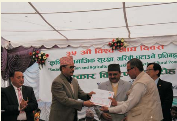
बर्दियाको पदनाहास्थित बुढान कृषक बहुमूखी कृषि सहकारी संस्थालाई पुरस्कृत गर्दै कृषि विकास मन्त्री हरिबोल प्रसाद गजुरेल ।