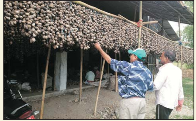
प्रशोधन गर्ने सुपारीको अवलोकन गर्दै कृषि सचिव