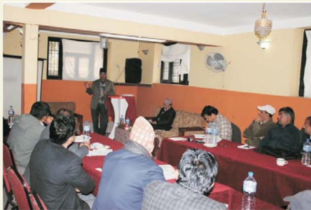
माननीय कृषि मन्त्री हरिबोल प्रसाद गजुरेल समिक्षा गोष्ठीमा निर्देशन दिँदै

यसै सिलसिलामा क्षेत्रीय स्तर समीक्षा पूर्वाञ्चल विकास क्षेत्रको विराटनगरमा मिति २०७२ श्रावण २० - २२ गतेमा, मध्यमाञ्चलको काठमाण्डौमा मिति २०७२ श्रावण १७ - १९ गतेमा पश्चिमाञ्चलको पोखरामा मिति २०७२ श्रावण १७ देखि १९ गतेसम्ममा मध्यपश्चिमाञ्चलको सुर्खेतमा मिति २०७२ श्रावण २० - २२ गतेमा र सुदूरपश्चिमाञ्चलको धनगढीमा मिति २०७२ श्रावण १४ देखि १५ गतेसम्ममा सम्पन्न भएको थियो। त्यस्तै गरी कृषि विभाग, पशुसेवा विभाग, र खाद्य प्रविधि तथा गुण नियन्त्रण विभागको पनि विभाग स्तरमा समीक्षा गरिएको थियो। मन्त्रालय स्तरमा वैदेशिक आयोजनाहरू र बोर्ड संस्थान परिषदहरूको छुट्टै समीक्षा गरिएको थियो। जसमा वैदेशिक आयोजनामा १५ वटा आयोजनाहरूको समीक्षा गरिएको थियो जसमा १३ वटा रातो कितावमा रहेका आयोजनाहरू र २ वटा रातो कितावमा नरहेका आयोजनाहरूको समीक्षा गरिएको थियो। समग्र आयोजनाहरू भारत र वित्तिय प्रगति क्रमशः ४७.२ र ७१.९ प्रतिशत प्रगति भएको थियो।