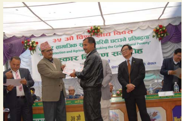
लमही, दाङमा माछाका भुरा उत्पादन गर्ने कृषकलाई पुरस्कृत गर्दै कृषि विकास मन्त्री हरिबोल प्रसाद गजुरेल ।