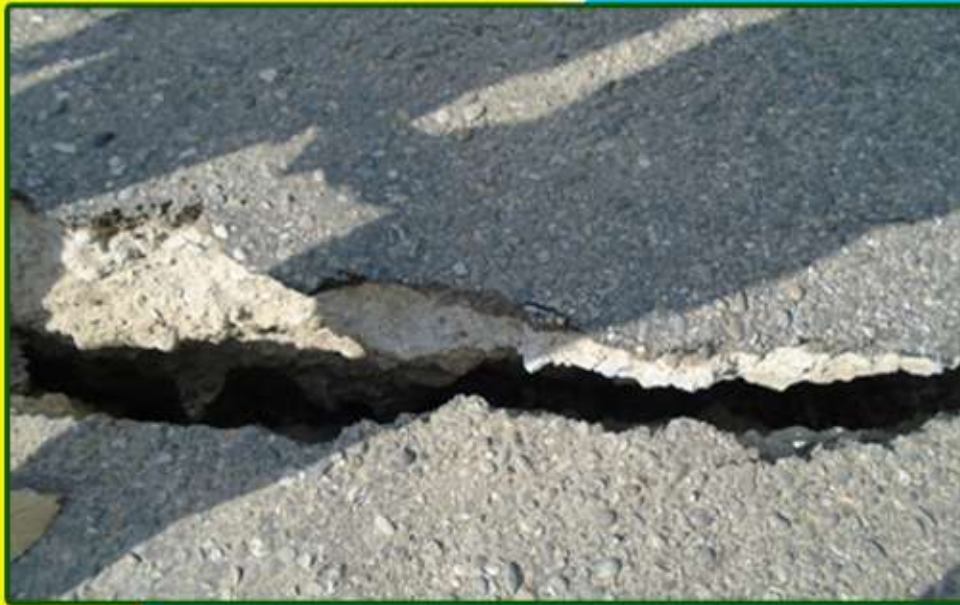
भुकम्पले जमिन चिरा परेको