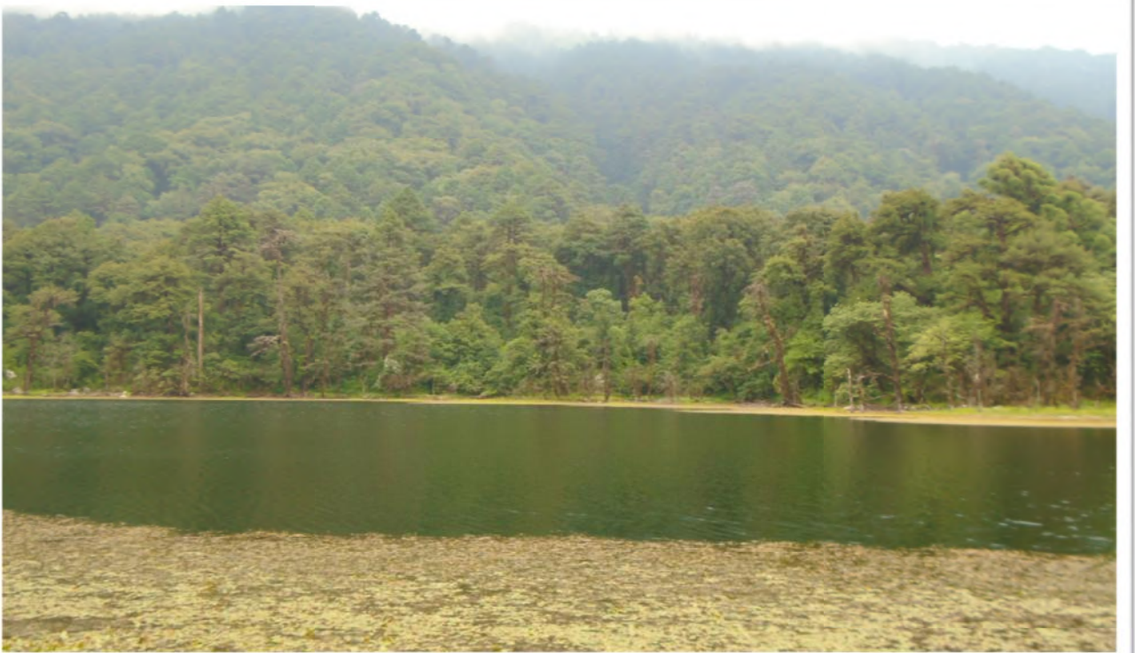
पर्यटकिय क्षेत्र रामारोशन ताल, अछाम