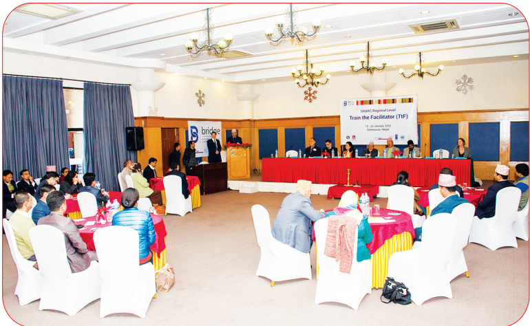
काठमाडौंमा सम्पन्न सार्कस्तरीय ब्रिज TIF को उद्घाटन कार्यक्रम