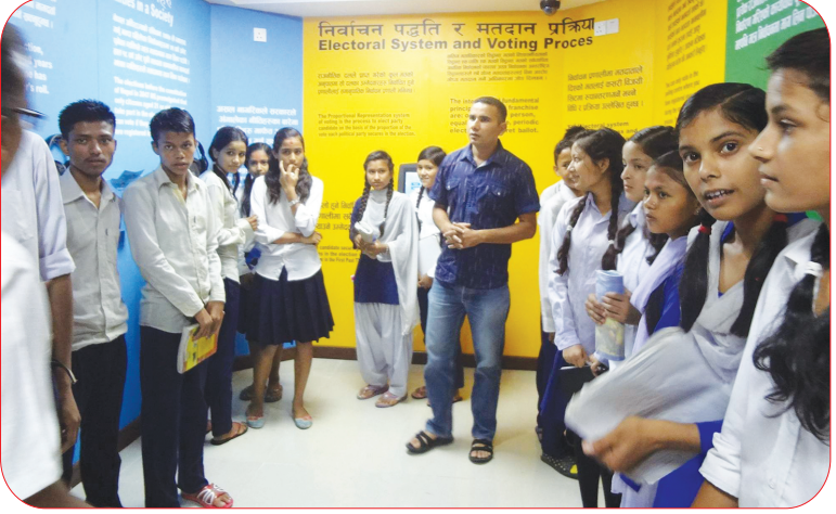
क्षेत्रीय निर्वाचन शिक्षा तथा सूचना केंद्र, कैलालीको भ्रमण गर्दै विद्यार्थीहरू