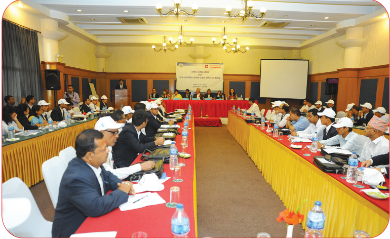
वार्षिक समीक्षा तथा दोस्रो रणनीतिक योजनाका सहभागीहरू