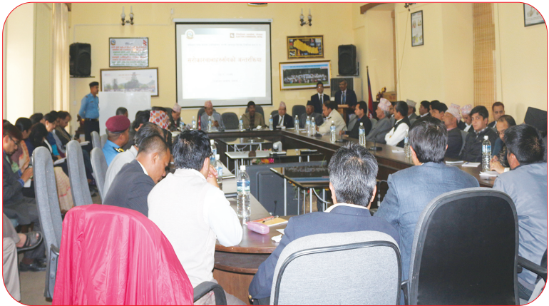
निर्वाचन आचार संहितासम्बन्धी सरोकारवालाहरूसँगको अन्तरक्रिया कार्यक्रमका सहभागीहरू