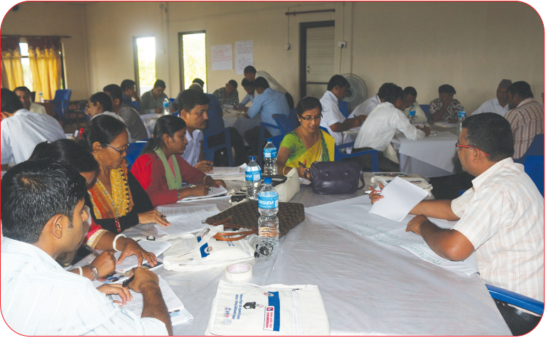
सामाजिक अध्ययन विषयक शिक्षकका लागि सञ्चालित निर्वाचन शिक्षा प्रशिक्षणका सहभागीहरू