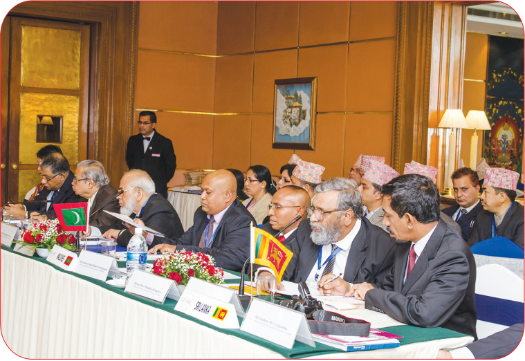
नेपालमा सम्पन्न FEMBoSA को पाँचौँ बैठकका सहभागीहरू