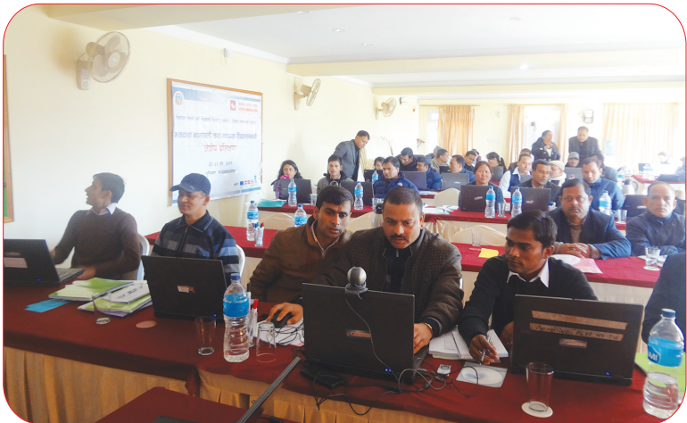
मतदाता नामावली सङ्कलन, अद्यावधिक तथा मतदाता शिक्षासम्बन्धी तालिमका सहभागीहरू