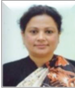
निर्वाचन आयुक्त श्री इला शर्मा