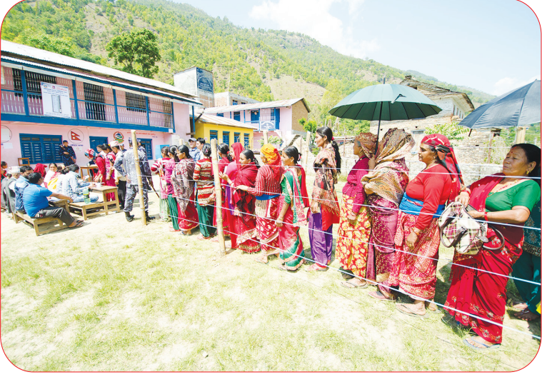
वाग्लुङ जिल्ला क्षेत्र नं. १ को संविधानसभा सदस्य उपनिर्वाचनमा मतदान गर्न लामबद्ध मतदाताहरू