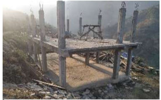
मारुनी सामुदायिक होमस्टे, जैमिनी नपा-३, बागलुङ

२०. अनुदान वितरण र उपयोग : होमस्टेमा पर्यटन विकास तथा पूर्वाधार व्यवस्थापन गर्न पुँजीगत अनुदान दिने सम्बन्धी कार्यविधि, २०७५ बमोजिम पर्यटन पूर्वाधार निर्माणको लागि २०७५।७६ मा २७४ होमस्टेलाई रु.२८ करोड ८७ लाख ४२ हजार अनुदान प्रदान गरेको छ । अनुदान प्राप्त विभिन्न ४० होमस्टेको स्थलगत निरीक्षण गरेकोमा अनुदानबाट निर्माण भएका पूर्वाधारको अवस्था निम्नानुसार देखिएको छ: