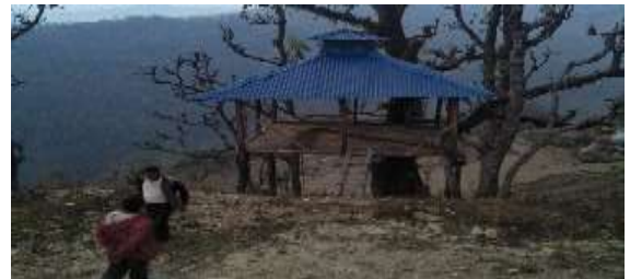
भरकोट सामुदायिक होमस्टे, मोदी गाउँपालिका, पर्वत

२०.२. पिप्रहर सामुदायिक होमस्टे, देवचुली-१७, नवलपुरको सामुदायिक भवन निर्माण कार्यको लागि रु.१० लाख अनुदान प्रदान भएको र सोबाट साविकको सामुदायिक भवनमा तला थप गरेकोमा तला थप कार्य अनुदान प्रदान गरेको २ वर्षसम्म पनि निर्माणाधीन अवस्थामा रहेको छ ।