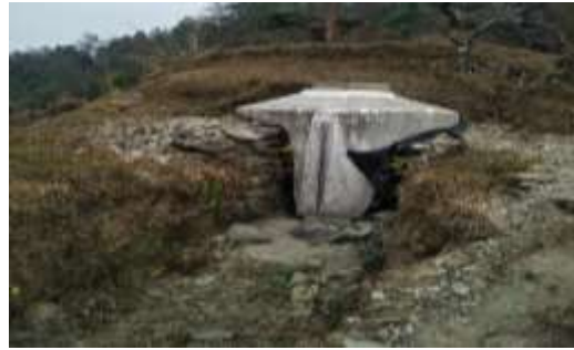
जयगाँउ सामुदायिक होमस्टे, मोदी गाउँपालिका-६, पर्वत

२०.४. जयगाँउ सामुदायिक होमस्टे, मोदी गाउँपालिका-६, पर्वतले रु.१० लाख अनुदान र होमस्टे संचालकको रु.२ लाख लागत सहभागिता समेत रु.१२ लाखबाट सामुदायिक होमस्टे निर्माण, ईन्टरनेट जडान, पानी टंकी निर्माण सम्बन्धी कार्य गरेकोमा पानीको स्रोत अभावमा निर्माण गरेको पानी टंकी प्रयोगमा आएको छैन । यसरी पानीको स्रोत उपलब्धताको व्यवस्था नगरी टयाँकी मात्र बनाएको उपलब्धमूलक देखिएन ।