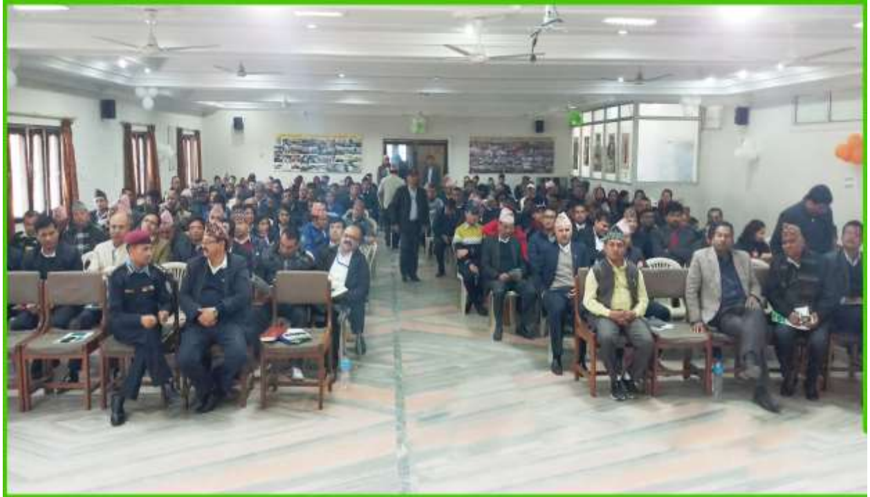
प्रदेश नं. १ विराटनगरमा आयोजित लेखापरीक्षण अन्तरक्रिया कार्यक्रममा सहभागी पदाधिकारीहरु