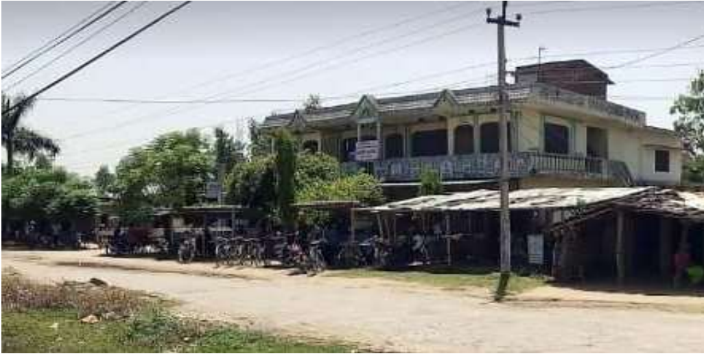
-कार्यालय रहको भवन (बाहलमा)

जग्गाको न्यूनतम मूल्याङ्कन पुस्तिका आ.व. २०७८/०७९