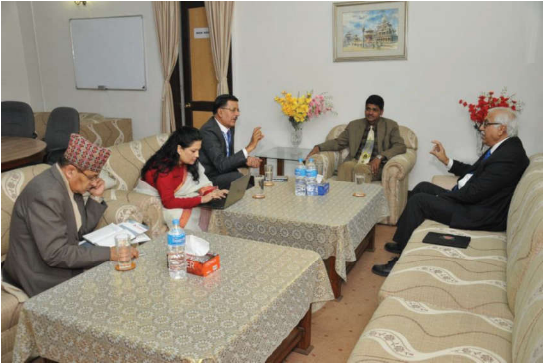
आयोगका वर्तमान तथा पूर्व पदाधिकारीसँग भेट गर्दै भारतका पूर्व प्रमुख निर्वाचन आयुक्त डा एस.वाई. कुरेसी