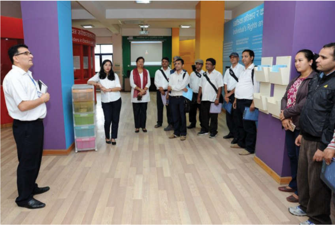
निर्वाचन शिक्षा तथा सूचना केन्द्रमा जानकारी लिँदै आगन्तुकहरू