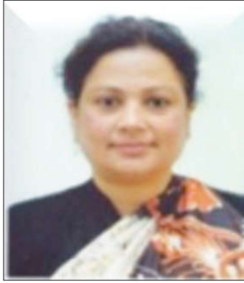
निर्वाचन आयुक्त श्री इला शर्मा