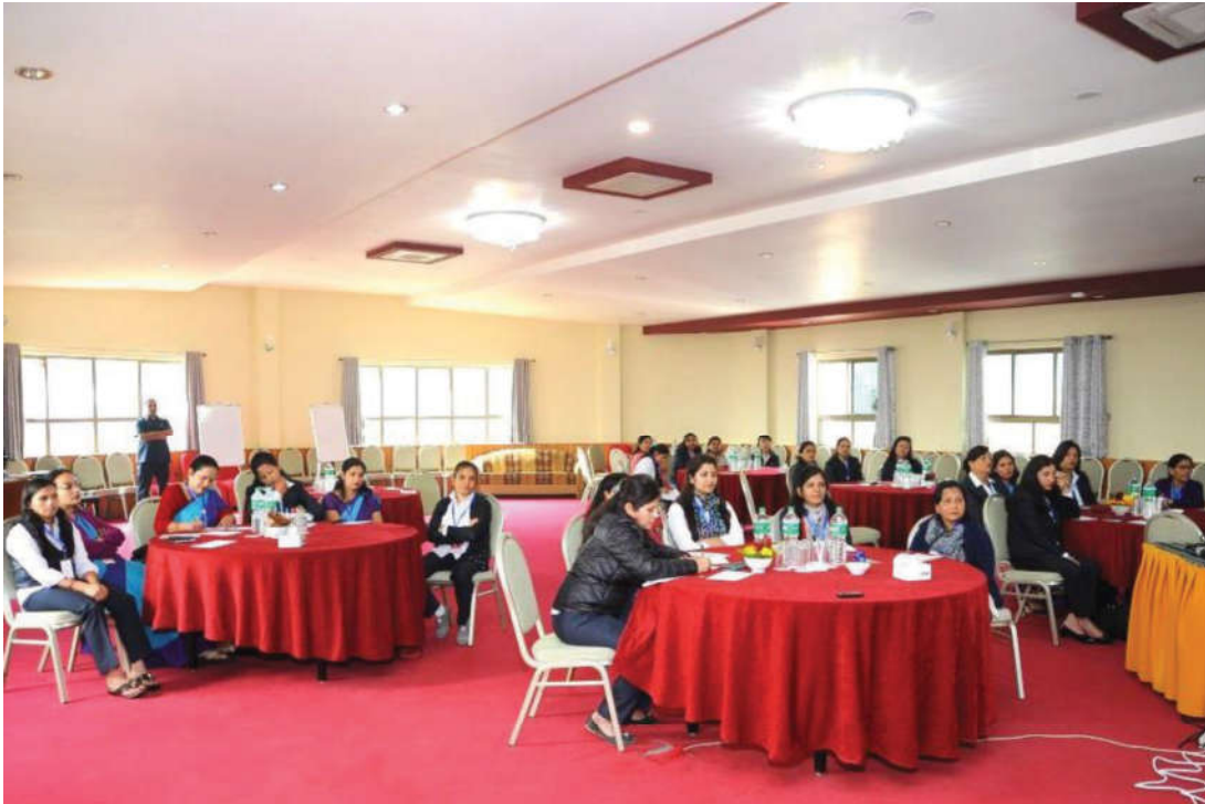
आयोग र अन्तर्गतका महिला कर्मचारीहरूका लागि आयोजित प्रशासनिक नेतृत्व विकास तालिममा सहभागीहरू