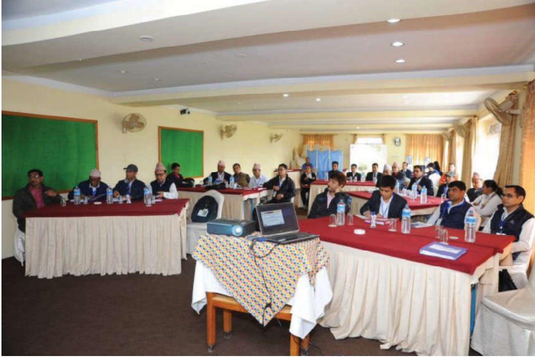
आयोग र अन्तर्गतका नवप्रवेशी कर्मचारीहरूका लागि आयोजित ब्रिज प्रशिक्षण कार्यशालामा सहभागीहरू