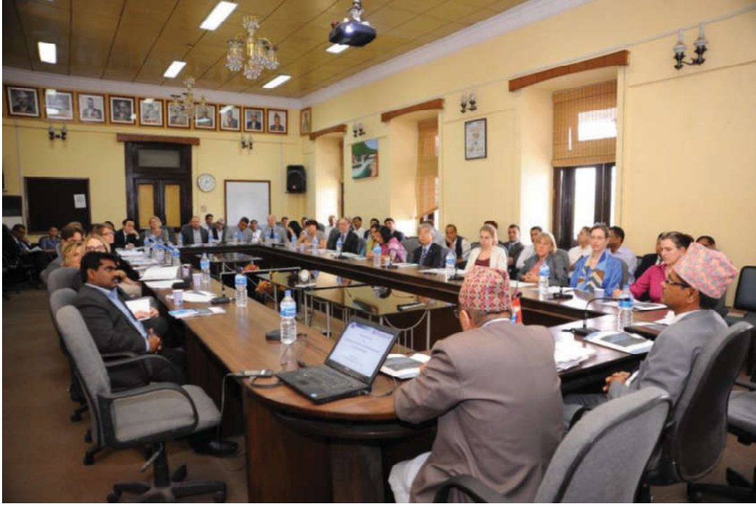
दातृनिकायका प्रतिनिधिहरूसँग आयोगमा आयोजित अन्तरक्रिया कार्यक्रम