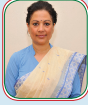
निर्वाचन आयुक्त श्री इला शर्मा