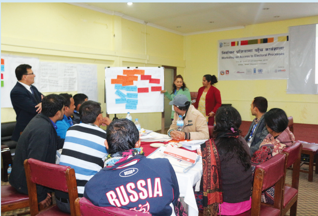
निर्वाचन प्रक्रियामा पहुँच विषयक कार्यशालामा सहजकर्ता तथा सहभागीहरू

भरतपुरमा सम्पन्न ब्रिज कार्यशालामा आइएफइएस नेपालको सहयोग रहेको थियो भने तानसेनमा सम्पन्न ब्रिज कार्यशालामा युएनडिपी इएसपीको सहयोग रहेको थियो ।