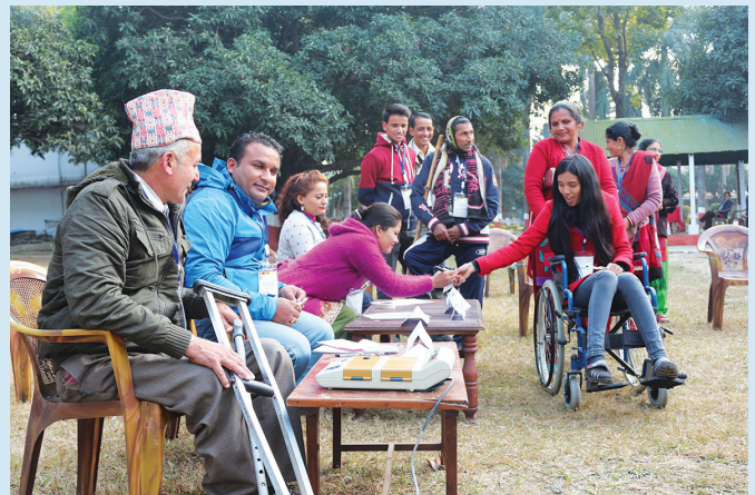
निर्वाचन प्रक्रियामा लैङ्गिक तथा समावेशिता विषयक कार्यशालामा नमूना मतदान गर्दै सहभागीहरू