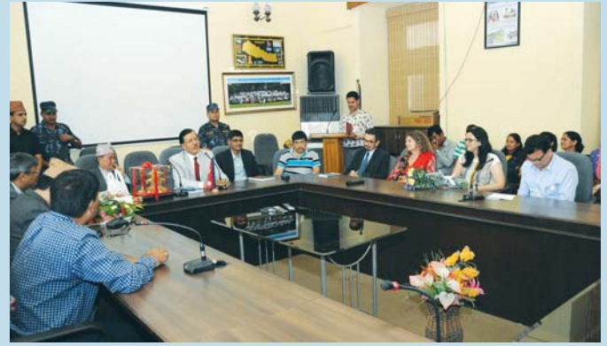
प्रमुख निर्वाचन आयुक्त श्री नीलकण्ठ उप्रेतीको विदाइका क्रममा आयोगको सभाहलमा उपस्थित आयोगका पदाधिकारी र कर्मचारीहरू