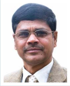
निर्वाचन आयुक्त डा. अयोधीप्रसाद यादव