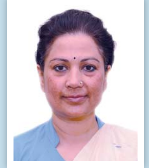
निर्वाचन आयुक्त श्री इला शर्मा