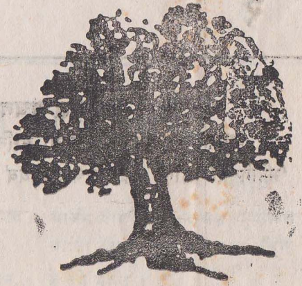
ने. कां या चुनाव चि

दं: १ २०४६ जेष्ठ ५ १११२ बछलागा सोम बा: दुत्या १९६२ मे १८ परीक्षण त्या: १