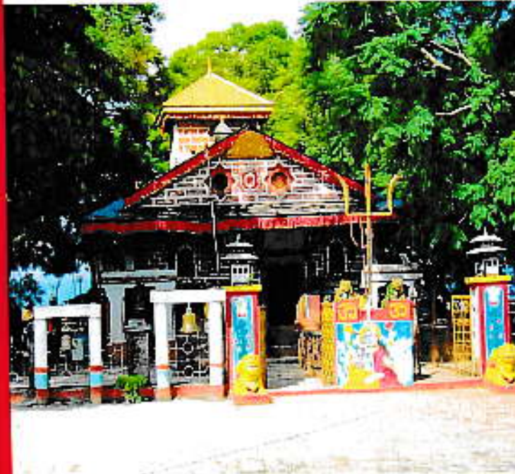
वाँया:- शैलेश्वरी मन्दिर, डोटी