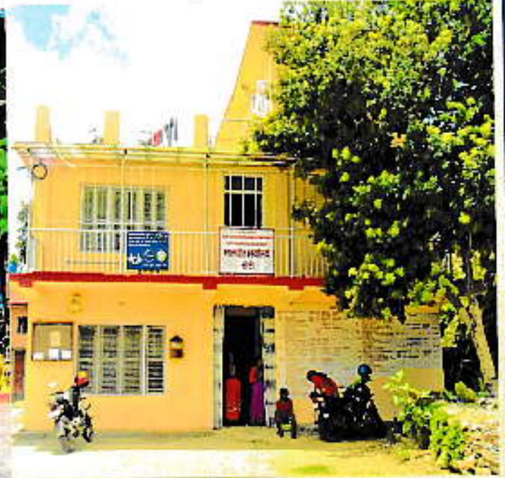
दाँया:- मालपोत कार्यालय, डोटी