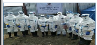
नमुना संकलन पश्चात राष्ट्रिय जनस्वास्थ्य प्रयोगशालाको टोली

"सामाजिक सञ्जाल एवम आम सन्चार माध्यमबाट तथ्यपरक र यथार्थ सन्देशहरू प्रसारण गरिदिनुहुन अनुरोध छ |"