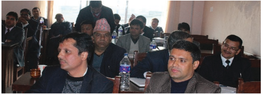
कार्यक्रममा उपस्थित प्रमुख कर प्रशासकहरू

वैठक बसेर अनुगमन गर्न पनि निर्देशन दिनुभयो । त्यसैगरी कतिपय अवस्थामा करमा दर्ता गरी व्यवसायी भाग्ने प्रवृत्ति बढेकोले दर्ता प्रकृत्यामा चनाखो रहन समेत निर्देशन दिनुभयो ।