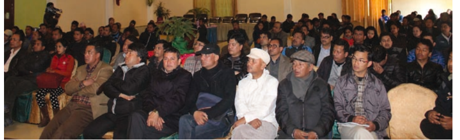
कार्यक्रममा उपस्थित व्यवसायीहरू

हुनुपर्ने भन्ने उहाँको भनाइ थियो । कार्यपत्रमा मूल्य अभिवृद्धि करमा दर्ता भए पश्चात् पालना गर्नुपर्ने व्यवस्था र व्याज, शुल्क, दण्ड तथा जरिवानाका विषय पनि उल्लेख गर्नु भएको थियो ।