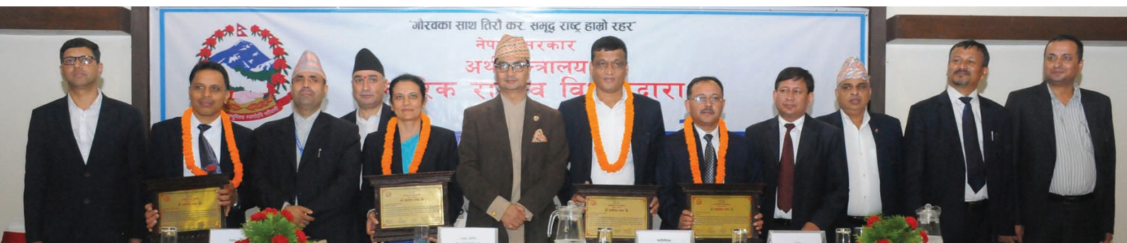
उत्कृष्ट कार्य सम्पादन गर्ने कर्मचारीहरूसँग माननीय अर्थराज्य मन्त्री लगायत अन्य विशिष्ट पदाधिकारीहरू

गरिएको बताउनुभयो । आर्थिक वर्ष २०७३/७४ मा विगतको तुलनामा कार्यालयहरूको समग्र कार्य सम्पादन मूल्यांकनको प्रगति राम्रो भएको, ३६ कार्यालयहरू मध्ये १९ कार्यालयहरू A++, १३ कार्यालय A+ र ४ कार्यालय A स्तरमा रहेको बताउनु भयो । स्वेच्छिक कर सहभागिताको माध्यमबाट करदातामैत्री कर प्रशासन, पारदर्शीता र जवाफदेहितालाई कार्य सम्पादनको मूल आधार मान्दै सुशासनको माध्यमबाट राजस्व