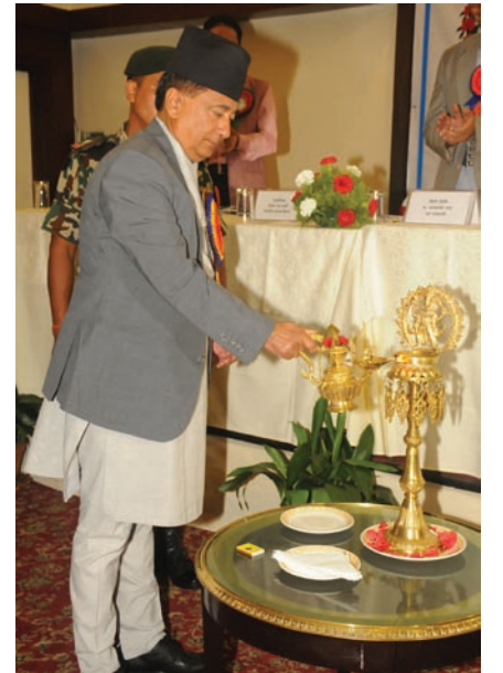
पानसमा बत्ती बालेर कार्यक्रमको उद्घाटन गर्नुहुँदै अर्थमन्त्री श्री ज्ञानेन्द्रबहादुर कार्की

काठमाडौं। माननीय अर्थमन्त्री ज्ञानेन्द्रबहादुर कार्कीले आन्तरिक राजस्व विभागको भदौ २० र २१ गते संचालन भएको व्यवस्थापन गोष्ठीको पानसमा बत्ती बाली भदौ २० गते मंगलवार उद्घाटन गर्नु भयो। कार्यक्रममा माननीय अर्थमन्त्री कार्कीले आगामी दिनमा विभागको दिशा निर्देश गर्नको लागि, समस्याहरु पहिचान गर्दै प्रभावकारी रूपमा विभागलाई समृद्धिको बाटोमा लान व्यवस्थापन गोष्ठी अप्रसर हुने अपेक्षा गर्नु भएको थियो।