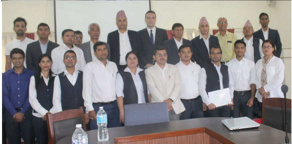
आधारभूत लेखा तालिममा सहभागी कर्मचारीहरू

कर अधिकृतहरूले सिकेका ज्ञान व्यवहारमा उतार्नुहुनेछ, भन्नुहुँदै करदाताले पेश गरेका विवरणहरू अध्ययन गर्न सक्षम हुनुहुनेछ,