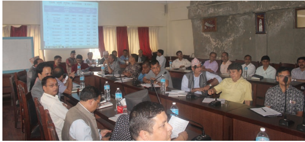
कार्यक्रममा उपस्थित कर्मचारीहरू

कर्मचारीहरूलाई सदाचारयुक्त आचरण व्यवहारमा उतार्न निर्देशन दिनुहुँदै आफूहरू पातलो सिसाको घरमा भएकाले एकजनाले