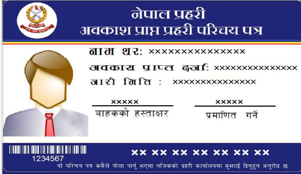
Card 1, अगाडिको भाग