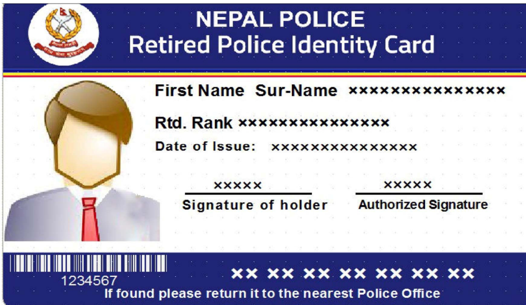
Card 2, पछाडिको भाग