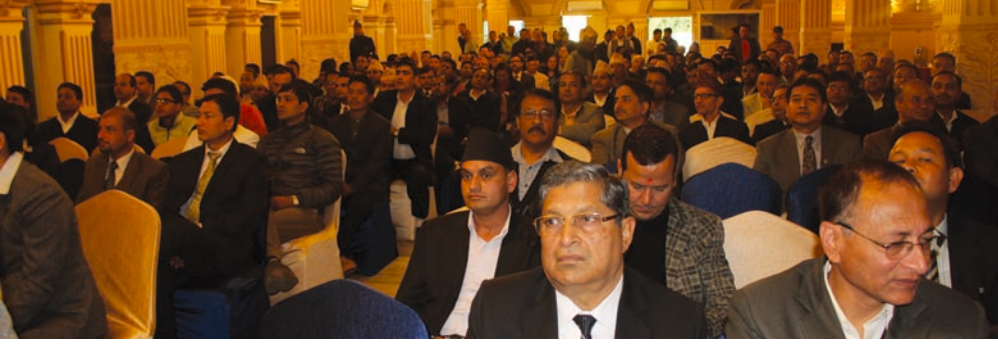
कार्यक्रममा उपस्थित कर्मचारी तथा व्यवसायीहरू

स्रोत नै कर भएको बताउनुहुँदै सम्मानित सबै करदाता र कर्मचारीको कर्तव्य अझै प्रभावकारी भएर अधि बढोस् भन्ने शुभकामना दिनुभयो । विभागको तर्फबाट व्यवसायीलाई कुनै सहयोगको आवश्यकता भए आफूले गर्ने प्रतिवद्धता समेत व्यक्त गर्नुभयो ।