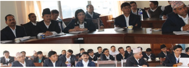
कार्यक्रममा उपस्थित कर प्रशासनका कर्मचारीहरू