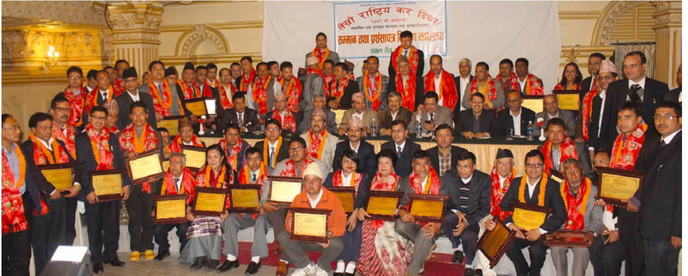
आन्तरिक राजस्व विभाग अन्तर्गतका कार्यालयबाट सम्मानित व्यक्ति तथा संस्थाहरू