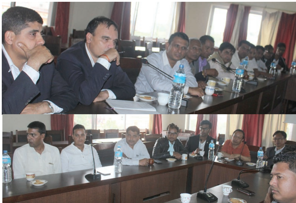
मदिरा व्यवसायीसंग भएको कार्यक्रममा सहभागीहरू