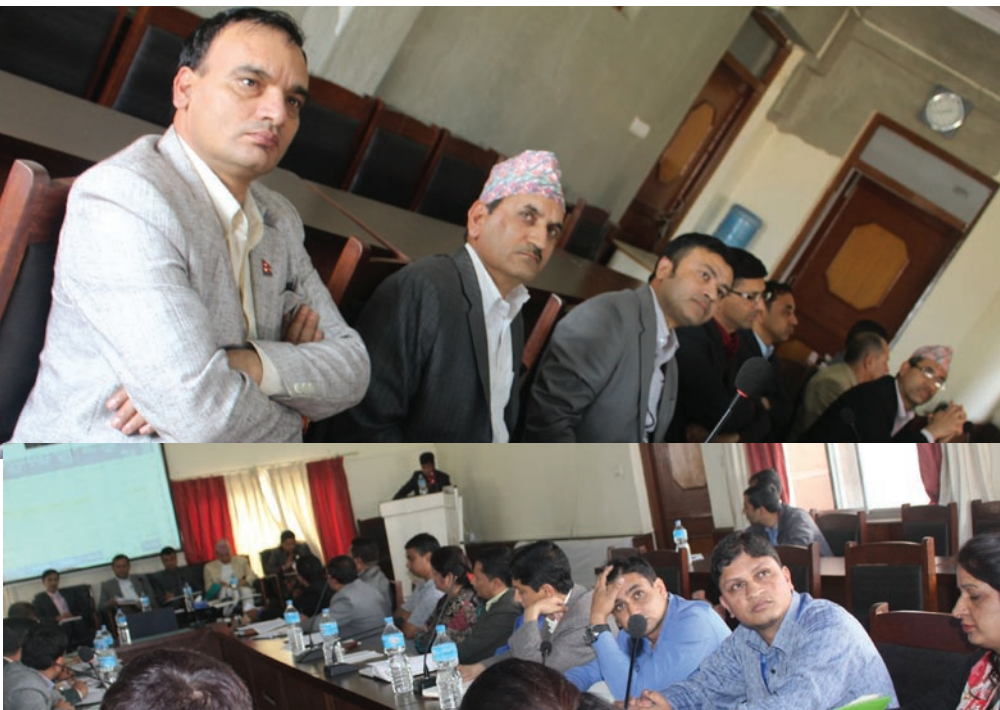
मासिक समीक्षा कार्यक्रममा सहभागी कर्मचारीहरू

मूल्य अभिवृद्धि गरेको वृद्धिदर कमजोर देखिएको बताउनुहुँदै २०७१/७२ को तुलनामा ३ प्रतिशत मात्र वृद्धिदर भएकोले पर्यटन क्षेत्रमा अनुगमन बढाउन निर्देशन गरिएको बताउनुभयो । नेपाल राष्ट्र बैंकको तथ्यांक अनुसार निक्षेपको वृद्धिदर ८ प्रतिशत, व्याज गरेको वृद्धिदर पनि ८ प्रतिशत रहनुले ठूला वित्तीय संस्थाहरूबाट आउनु पर्ने व्याज करमा ठूलो अन्तर नदेखिएको बताउनुभयो । सहकारी क्षेत्रको अनुगमन गर्न कार्यालयहरूलाई निर्देशन गरिएको बताउनुहुँदै सबै शिक्षण संस्था दायरामा आइसकेको तथा अहिले शिक्षण शुल्क र भर्ना शुल्कमा बढोत्तरी नभएकोले शिक्षा सेवा शुल्कको वृद्धिदर लक्ष्यभन्दा केही कम भएपनि सन्तोषजनक नै रहेको बताउनुभयो ।