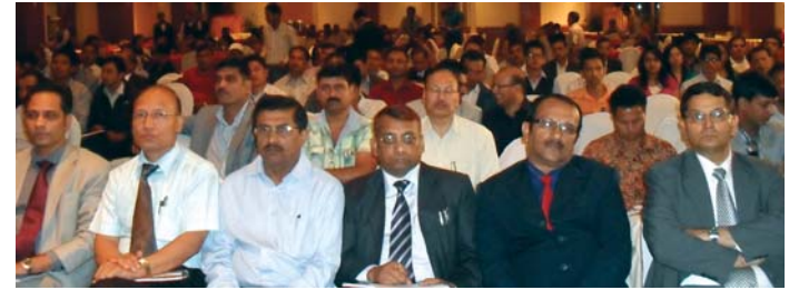
सञ्चार क्षेत्रका करदाताहरूसँग आयोजित अन्तरक्रियाका सहभागीहरू