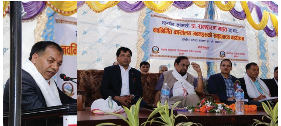
आन्तरिक राजस्व कार्यालय बुटवलको नवनिर्मित भवनको उद्घाटनपछिको कार्यक्रम

बुटवल बेलहिया व्यापारिक मार्ग परियोजना तथा मोतिपुर औद्योगिक कोरिडोर विकासका लागि सरकारले रकम अभाव हुन नदिने आश्वस्त पार्नुहुँदै रुपन्देही जिल्लालाई पश्चिमाञ्चल क्षेत्रकै Economic Hub का रुपमा विकास गर्ने कार्यमा सवै लागिपन सुझाव दिनुभयो।