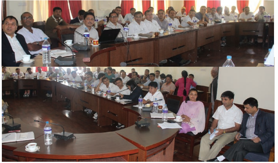
विभागमा आयोजित कार्यक्रममा कर प्रशासनका कर्मचारीहरू

कार्य सम्पादनका क्रममा आइ परेका समस्याहरू र त्यसलाई कसरी समाधान गर्ने भन्ने विषयमा सुभाव तथा समाधानको लागि कार्य योजना बनाई पेश गर्नको लागि व्यवस्थापन गोष्ठीमा उठेका तथा ६ वटा समूहबाट उठान भएका विषयहरूको समाधानका उपाय सहितको विवरण प्रस्तुत गरिएको थियो । प्रस्तुतीमा आन्तरिक राजस्व विभाग र अन्तर्गतका