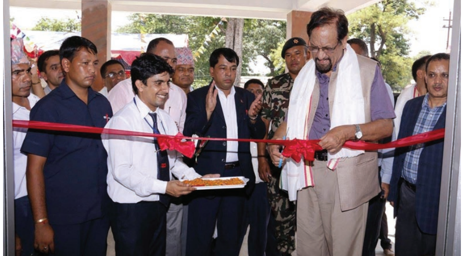
आन्तरिक राजस्व कार्यालय बुटवलको नवनिर्मित भवनको उद्घाटन गर्नुहुँदै अर्थमन्त्री डा. रामशरण महत

साथै डा. महतले समुचित राजस्व परिचालनबाट मात्र देशको आर्थिक सामाजिक तथा पूर्वाधार विकास सम्भव रहेको कुरा उल्लेख गर्नुहुँदै बजेट निकासामा सहजीकरण गरिएकोले बजेट कार्यान्वयन प्रभावकारी बनाउन जोड दिनुभयो। डा. महतले रुपन्देहीका उद्योगी व्यवसायी करदाताहरूलाई निर्माणायधिन