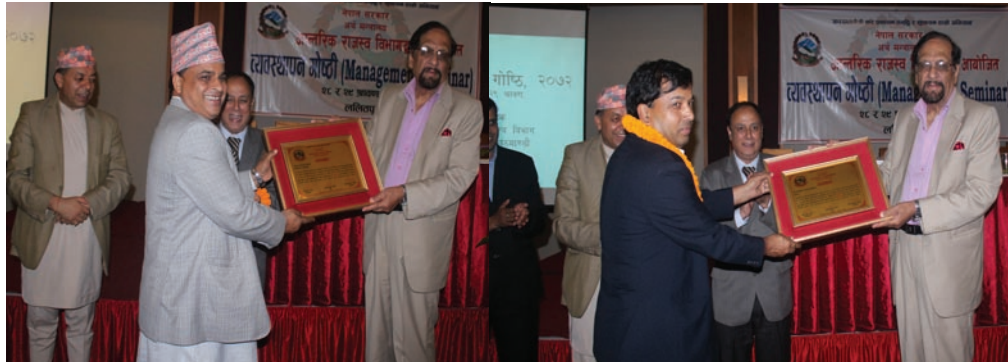
अर्थमन्त्री डा. रामशरण महतद्वारा कार्य सम्पादनमा क्रमशः प्रथम, द्वितीय, तृतीय र चौथो पुरस्कार प्राप्त कार्यालयहरुलाई सम्मान गर्नुहुँदै

लक्ष्य मात्र होइन अन्य जिम्मेवारीहरु पूरा गर्नको लागि प्रतिवद्ध रहेको र क्रियाशील भएर लाने कुरा पनि व्यक्त गर्नुभयो। अर्थमन्त्रालय राजस्व व्यवस्थापन महाशाखा, भन्सार विभाग, राजस्व अनुसन्धान विभाग, सम्पत्ति शुद्धिकरण विभाग, राजस्व प्रशासन तालिम केन्द्रबाट जुन किसिमको राय सुझाव सल्लाह दिनु भएको छ। त्यही आधारमा आगामी कार्यदिशा अगाडि बढाउने प्रतिवद्धता समेत व्यक्त गर्नुभयो। प्रथम, द्वितीय, तृतीय र सान्त्वना पुरस्कार पाउने कार्यालयभन्दा अरु कार्यालयले संकोच मान्नुपर्ने अवस्था छैन भन्नुहुँदै कार्य सम्पादन परिसूचकमा २२ कार्यालयहरु A+ भन्दा माथि रहेकोमा सवै कर्मचारीहरुमा हार्दिक आभार व्यक्त गर्नुभयो।