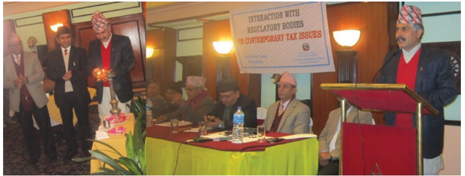
कार्यक्रमको उद्घाटन तथा सम्बोधन गर्नुहुँदै अर्थमन्त्री श्री शंकरप्रसाद कोइराला

आन्तरिक राजस्व विभागको आयोजनामा पुस २६ गते शुक्रवार होटल मल्लमा विभिन्न नियामक निकायसँग अन्तर्क्रिया कार्यक्रम सम्पन्न भएको छ। आर्थिक अध्यादेश २०७० ले प्रदान गरेको छुट सुविधाको समयावधी सकिनै लाग्दा विभिन्न नियामक निकायहरूलाई आफू अन्तर्गतका व्यवसायीहरूलाई छुट सुविधाको बारेमा जानकारी गराइदिन आग्रह गर्दै कार्यक्रमको आयोजना गरिएको हो। कार्यक्रममा प्रमुख अतिथि माननीय अर्थमन्त्री श्री शंकरप्रसाद कोइरालाले पुस महिना व्यवसायीहरूको लागि महत्वपूर्ण