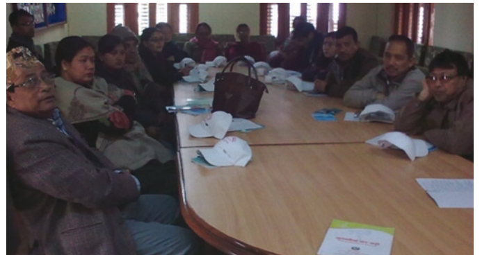
आन्तरिक राजस्व कार्यालय नेपालगञ्जद्वारा आयोजित कार्यक्रम

२०७० माघ २३ गते आन्तरिक राजस्व कार्यालय, नेपालगञ्जको आयोजनामा बचत तथा ऋण सहकारी संस्था लि. का पदाधिकारीहरूका साथ एक अन्तरक्रिया कार्यक्रम गरियो । सो अवसरमा प्रमुख