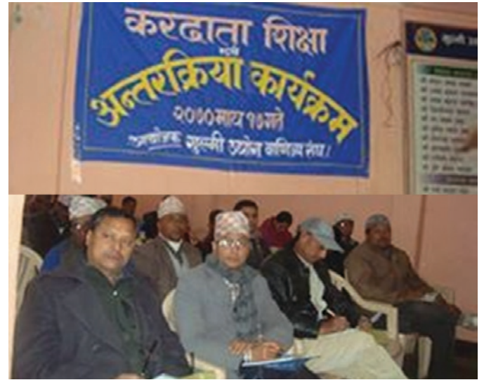
कार्यक्रममा उपस्थित उद्योगी व्यवसायीहरू

गुल्मी उद्योग वाणिज्य संघको आयोजनामा आन्तरिक राजस्व कार्यालय बुटवलका कर अधिकृत सहितको टोलीले गुल्मीका उद्योगी