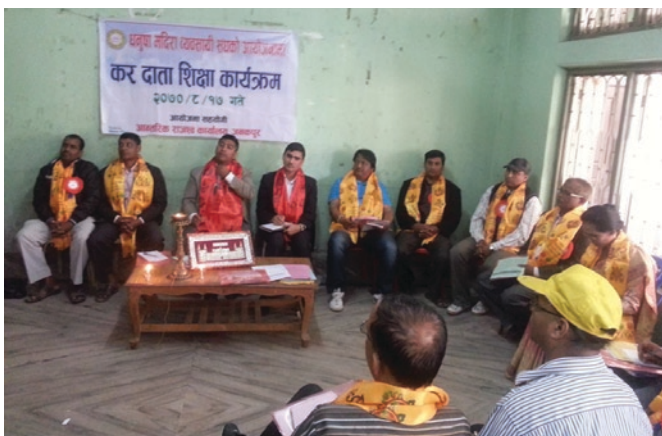
करदाता शिक्षा कार्यक्रममा सहभागी कर्मचारी तथा व्यवसायीहरू

आन्तरिक राजस्व कार्यालय, जनकपुरले पुस ७ गते सर्लाहीको मलंगवामा, पुस ६ गते महोत्तरीको मटिहानीमा र मंसिर २८ गते सिन्धुलीमा करदाता शिक्षा तथा कर शिविर कार्यक्रमहरू सम्पन्न गरेको छ। सर्लाहीको मलंगवामा सञ्चालित कार्यक्रम सर्लाही उद्योग वाणिज्य संघका कार्यवाहक