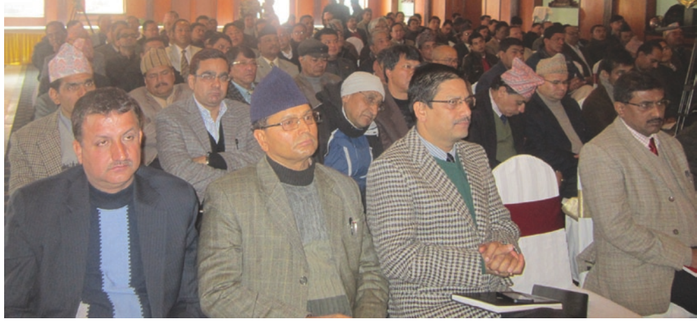
कार्यक्रममा उपस्थित कर प्रशासक तथा नियामक निकायका प्रमुखहरू