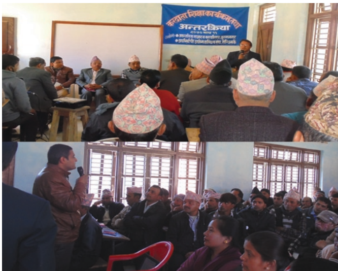
आन्तरिक राजस्व कार्यालय कृष्ण नगरले आयोजना गरेको कार्यक्रम

आन्तरिक राजस्व कार्यालय कृष्णनगर कपिलवस्तुको आयोजना र उद्योग वाणिज्य संघ अर्घाखाँचीको संयोजकत्वमा माघ ११ गते