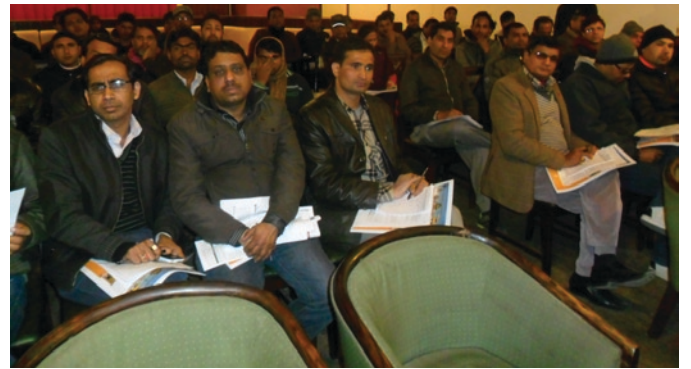
करदाता सेवा कार्यालय त्रिपुरेश्वरले आयोजना गरेको कार्यक्रम

करदाता सेवा कार्यालय, त्रिपुरेश्वर र काठमाडौं विद्युतीय व्यवसायी संघको संयुक्त आयोजनामा पुष २६ गते शुक्रवारका दिन सुन्दारास्थित धरहरा बेकरी क्याफेमा कर शिक्षा तथा अन्तरक्रिया कार्यक्रम सम्पन्न भयो । सो कार्यक्रमको मुख्य उद्देश्य आयकर तथा मू.अ.करमा दर्ता भएपछि पुरा गर्नुपर्ने कानुनी दायित्वहरूको जानकारी दिँदै करदाता र कर प्रशासन विच मैत्रीपूर्ण वातावरण निर्माण गरी कर सहभागितालाई