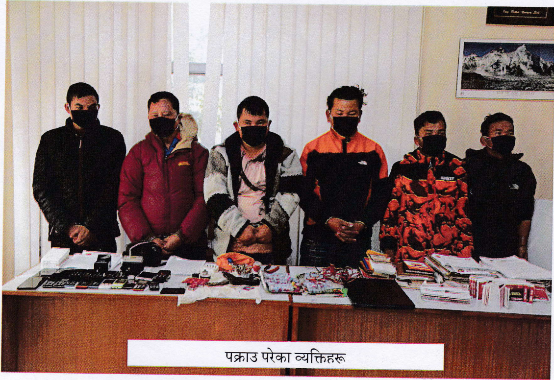
पक्राउ परेका व्यक्तिहरू