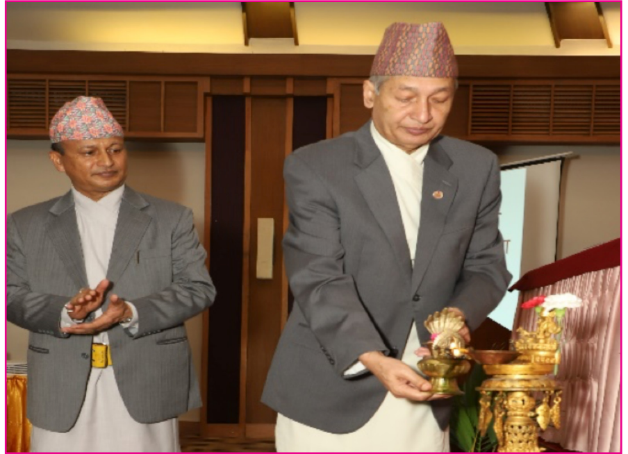
पानसमा दीप प्रज्वलन गरेर गोष्ठीको औपचारिक शुभारम्भ गर्नु हुँदै माननीय अर्थ मन्त्री

आन्तरिक राजस्व विभाग र अन्तर्गतका कार्यालयहरूले आर्थिक वर्ष २०७५/७६ मा लिइएका राजस्व नीति तथा कार्यक्रम