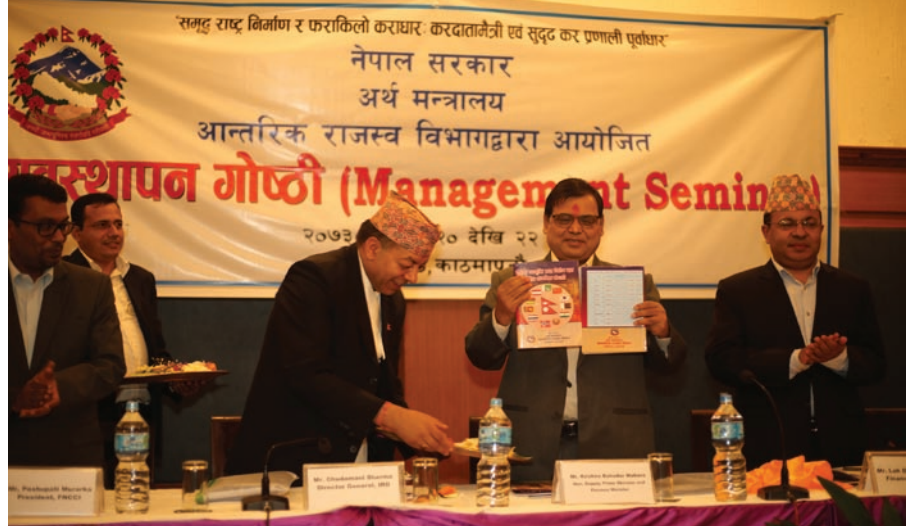
विभागद्वारा प्रकाशित पुस्तकको लोकार्पण गर्नुहुँदै माननीय अर्थमन्त्री श्री कृष्णबहादुर महरा

काठमाडौं । आन्तरिक राजस्व विभागले यही २०७३ साल साउन २० देखि २२ सम्म बुढानिलकण्ठ, काठमाडौंमा सञ्चालन गरेको व्यवस्थापन गोष्ठी २१ बुँदे घोषणापत्र जारी गर्दै सम्पन्न भएको छ ।