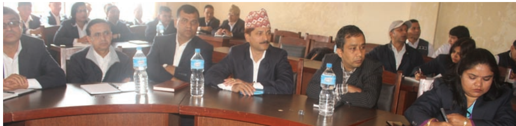
छलफल कार्यक्रममा सहभागीहरू

कार्यक्रममा विभिन्न उपसमितिहरूबाट पाँचौँ राष्ट्रिय कर दिवस २०७३ सफल पार्न गरेका कामका वारेमा प्रस्तुत गरिएको थियो । जसमा विभागले सञ्चालन गरेको हाजिरी जवाफ प्रतियोगिता, कविता प्रतियोगिता, निबन्ध प्रतियोगिता लगायत मंसिर १ गते विमोचन गर्न लागिएको वार्षिक प्रतिवेदन २०७३, स्मारिका २०७३ र कर सम्बन्धी फैसला/नजिरहरूको संग्रह प्रकाशनमा भएको प्रगतिका सम्बन्धमा उपसमितिका संयोजकहरूले स्पष्ट पार्नु भएको थियो ।