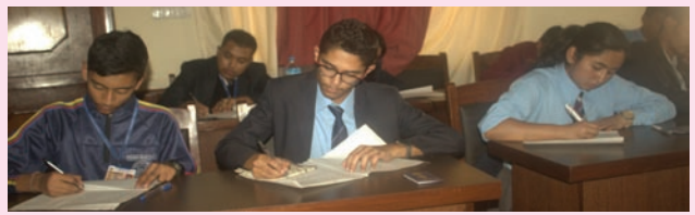
निबन्ध प्रतियोगितामा सहभागी विद्यार्थीहरू

प्रतियोगिता कात्तिक २६ गते सम्पन्न गरेको छ । कक्षा ९ देखि १२ सम्म अध्ययनरत ४८ जना विद्यार्थीहरू प्रतियोगितामा सहभागी थिए । उपत्यका स्तरीय सो निबन्ध प्रतियोगितामा प्रथम, द्वितीय र तृतीय हुने प्रतियोगिहरूलाई आन्तरिक राजस्व विभागले मंसिर १ गते आयोजित विशेष कार्यक्रममा नगद रु २५ हजार, २० हजार र १५ हजार क्रमशः प्रदान गर्ने छ ।