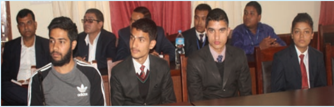
कविता प्रतियोगितामा सहभागी विद्यार्थीहरू

सन्देशमूलक कविता वाचन प्रतियोगिता कात्तिक २९ गते सम्पन्न भएको छ । कक्षा ११ देखि स्नातकसम्म अध्ययनरत २१ जना विद्यार्थीहरू प्रतियोगितामा सहभागी थिए । उपत्यका स्तरीय सो कविता वाचन प्रतियोगितामा प्रथम, द्वितीय र तृतीय हुनेलाई आन्तरिक राजस्व विभागले मंसिर १ गते आयोजित विशेष कार्यक्रममा नगद रु २५ हजार, २० हजार र १५ हजार क्रमशः प्रदान गर्ने छ ।