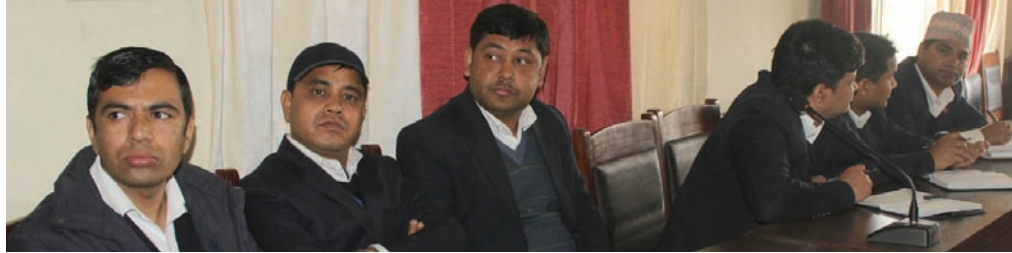
आन्तरिक राजस्व विभागमा आयोजित मासिक समीक्षा कार्यक्रममा सहभागी कर्मचारीहरू

बेरुजु, वक्यौता, संकलनलाई प्राथमिकता दिई सबै कार्यालयले सबै कर्मचारीलाई पछिल्लो एक हप्ता असुलीको कार्य गर्ने गरी निर्देशन गरिएको, सबै करदाताको विवरण अद्यावधिक गर्ने (KYT) कार्य प्रभावकारी रूपमा संचालन गरिएको, तोकिएका करदातामा ECR लाई प्रयोगमा