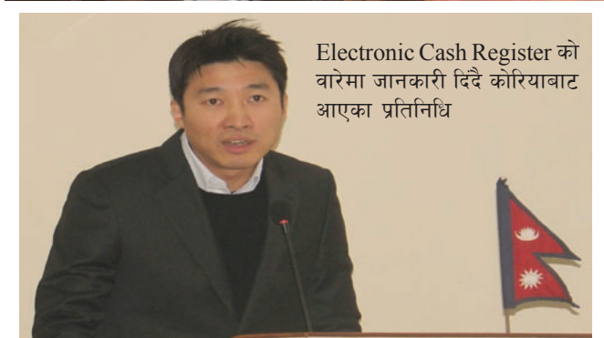
Electronic Cash Register को बारेमा जानकारी दिँदै कोरियाबाट आएका प्रतिनिधि