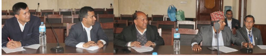
आन्तरिक राजस्व उपसमितिको बैठकमा सहभागी कर्मचारी तथा व्यवसायीहरू

फागुन २६ गते वसेको दोस्रो बैठकबाट प्रत्येक कार्यदलको संयोजकले आफ्नो कार्यदलको प्रथम बैठक सम्पन्न भएको जानकारी गराइएको थियो। आफ्नो सुझाव पेश गर्न ठूला करदाता कार्यालय लगायत सबै आन्तरिक राजस्व कार्यालय र करदाता सेवा कार्यालयलाई समेत आवाहन गरिएको छ। त्यसैगरी विभिन्न व्यावसायिक संगठनबाट सुझाव लिने, विगत