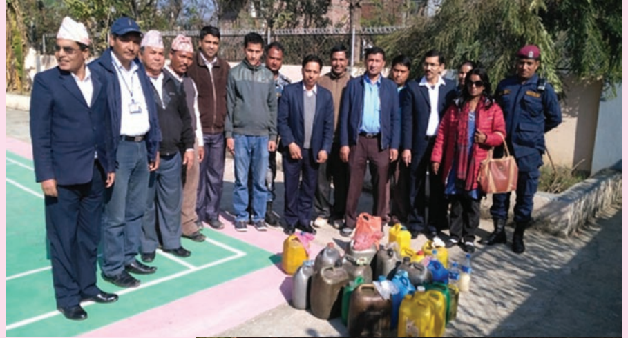
दाङ जिल्लाको बजार एरियावाट पक्राउ गरी नष्ट गर्न लागिएको अवैध मदिरा

काठमाडौं। आन्तरिक राजस्व कार्यालय, तुलसीपुर दाङले २०७३ माघ र फागुन महिनामा स्थानिय प्रहरी प्रशासनको समेत सहयोगमा दाङ घोराही क्षेत्रमा ५०० लिटर र तुलसीपुर क्षेत्रमा ३५० लिटर अवैध मदिरा पक्राउ गरी नष्ट गरेको छ। अवैध मदिरा अनुगमनको क्रममा बजार क्षेत्रमा अन्तशुल्क इजाजत प्रमाणपत्र नलिई कारोवार गरेका २० वटा व्यक्ति तथा फर्मको मदिरा पक्राउ गरी जफत समेत गरेको छ। बजार अनुगमनलाई तिब्रता दिएपछि, फागुन मसान्तसम्म अन्तशुल्क इजाजत