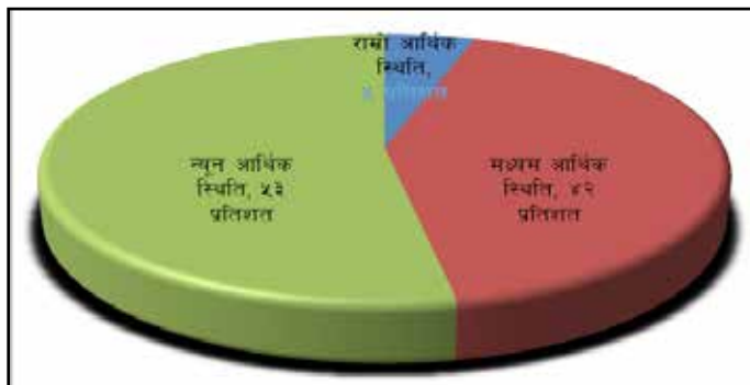
चित्र नं. १ बालबालिका बसेको घरको आर्थिक अवस्था

समुदायका २०३ जना उत्तरदाताहरूसंगको छलफलमा आधाभन्दा बढीले (५३%) बालबालिकालाई संरक्षण दिएको घरपरिवारको आर्थिक अवस्था दयनीय रहेको बताए भने ४२ प्रतिशत घरपरिवारको आर्थिक अवस्था ठीकै रहेको र मात्र ५ प्रतिशत घरपरिवारको आर्थिक अवस्था सबल रहेका पाइयो । यसरी आधाभन्दा बढी घर परिवारको दयनीय आर्थिक अवस्थाले गर्दा बालबालिकाले उचित शिक्षा दिक्षा र लालनपालन नपाएको, बालश्रम गर्नु परेको वा श्रममा जानु पर्ने जोखिम रहेको भन्ने समुदायको धारणा देखिन्छ । यसबाट अनाथ, एकल बाबु वा आमा एवम् आफन्त लगायत अन्यको संरक्षणमा रहेबसेका बालबालिकाको आधारभूत सेवासुविधाका लागि सरकारी स्तरबाट सहयोगको व्यवस्था हुन नितान्त आवश्यक देखिएको छ ।