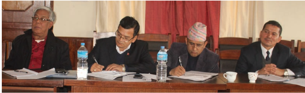
अवैध मदिरा नियन्त्रण समन्वय समितिको बैठकमा सहभागीहरू

(परिमार्जित संस्करण, २०७३) मा संशोधन भएका विषयमा प्रकाश पार्नु भएको थियो। सुरक्षा निकायका प्रतिनिधिले ट्राफिक व्यवस्थापनका कारण कार्यालय समयमा सामान बोक्ने सवारी साधनलाई केही असहज स्थिति भएको र त्यसलाई व्यवस्थित गर्ने प्रयासमा आफूहरू रहेको जानकारी दिनु भएको थियो।