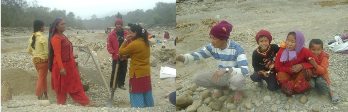
नवलपरासीको भरही खोलाबाट ढुंगावालुवा भिक्दै नावालिका ।