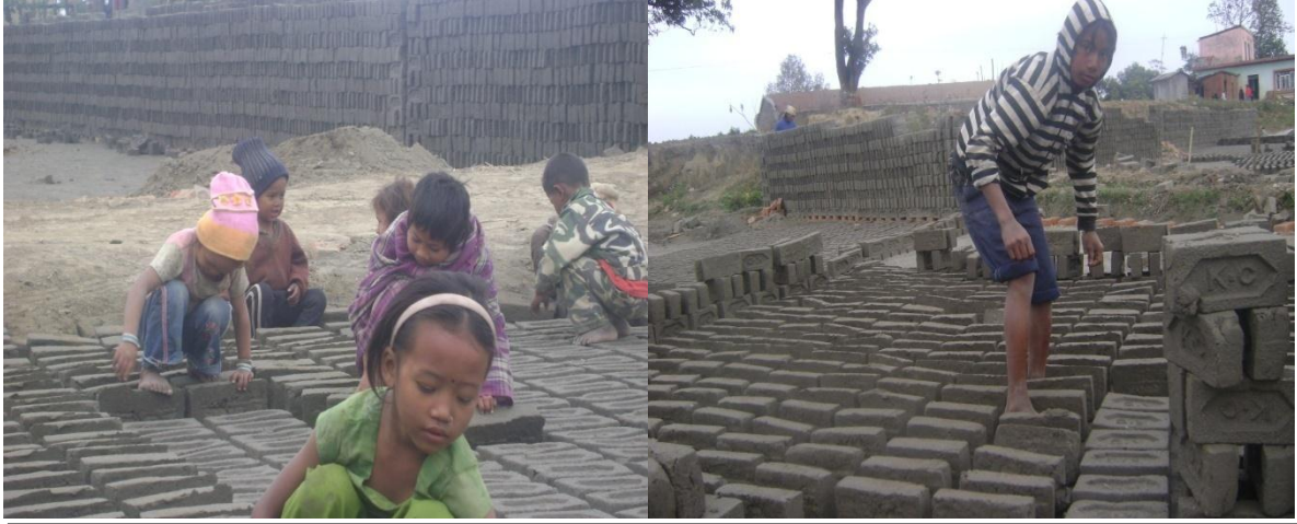
नवलपरासी जिल्लाको अमरापुरी गाविसमा रहेको इटा व्यवसायमा इटा पल्टाउने काम गर्दै बालबालिकाहरु ।