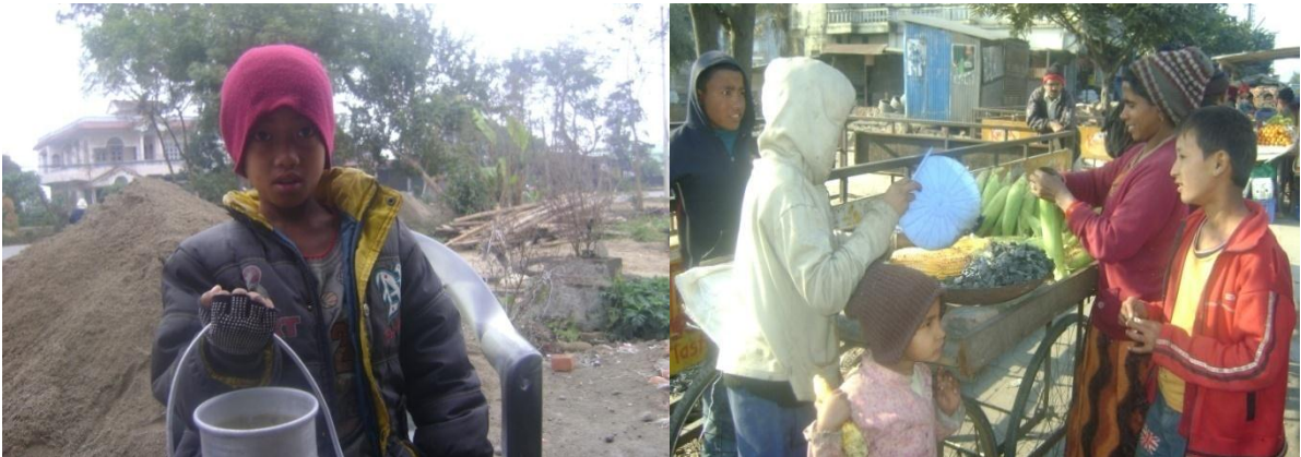
देवदह सहकारीमा दुध पुर्याउन आएका नावालिक ।