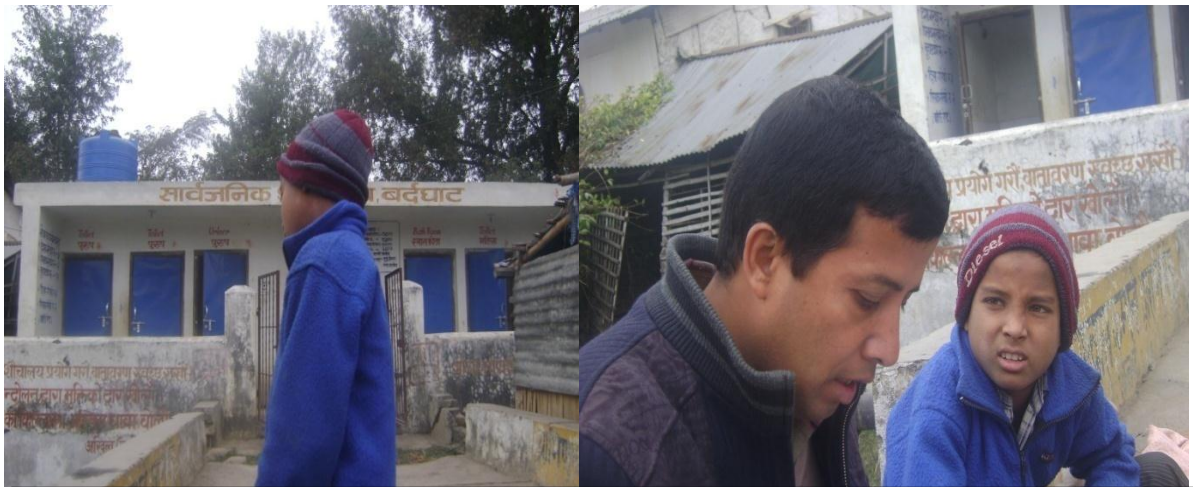
नवलपरासी जिल्लाको बर्दघाटमा बनेको सार्वजनिक शौचालयमा शुल्क उठाउन राखिएको नावालिक ।

वालश्रम सम्बन्धी उक्त अनुगमन निरीक्षण निरीक्षणको केही तस्वीरहरु पनि लिइएको थियो । तस्वीर आफैँ बोल्ने हुँदा सो को संक्षिप्त नोट त्यसै तस्वीर मुनि दिइएको छ । तस्वीर नं.१