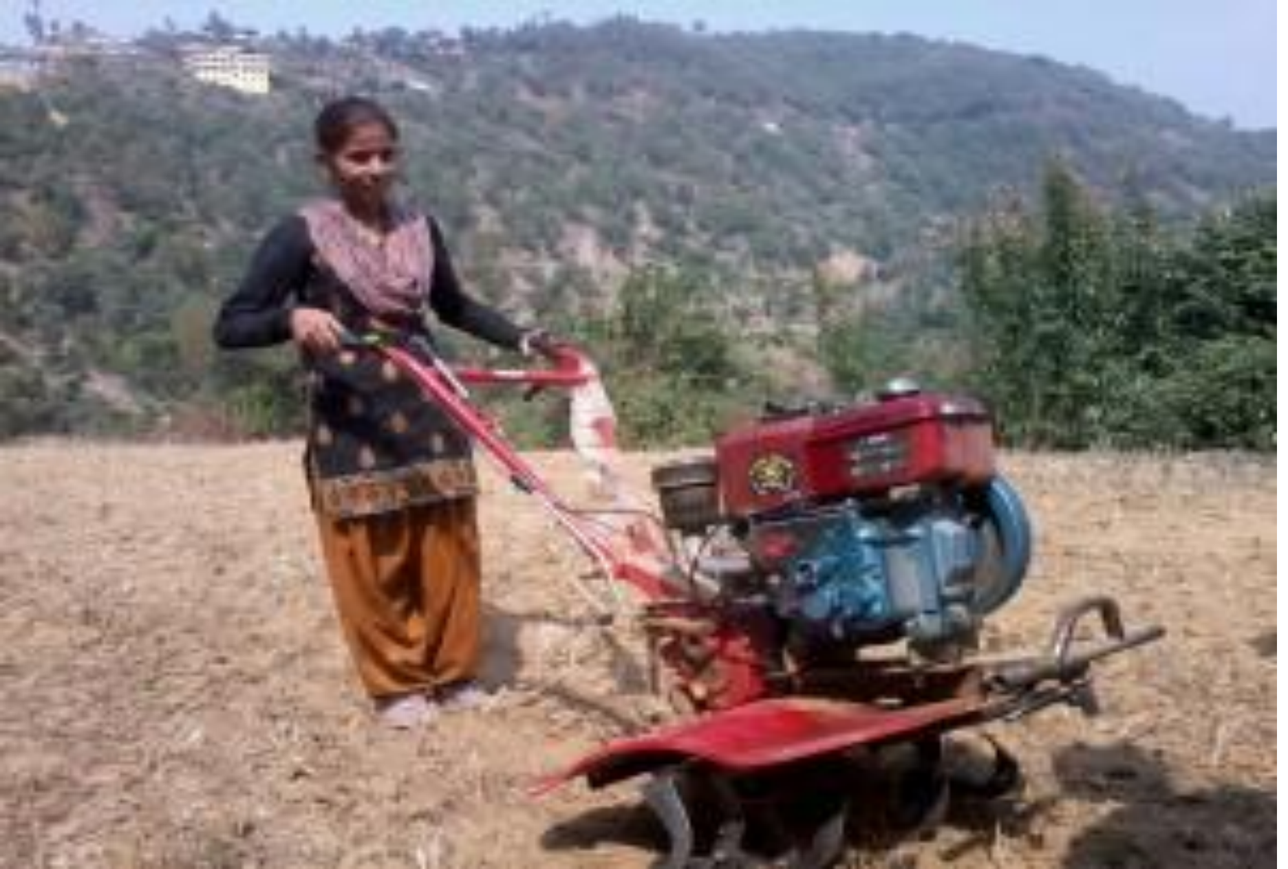
पहाडी जिल्लाहरु प्रयोग भै रहेको मिनिटिलर