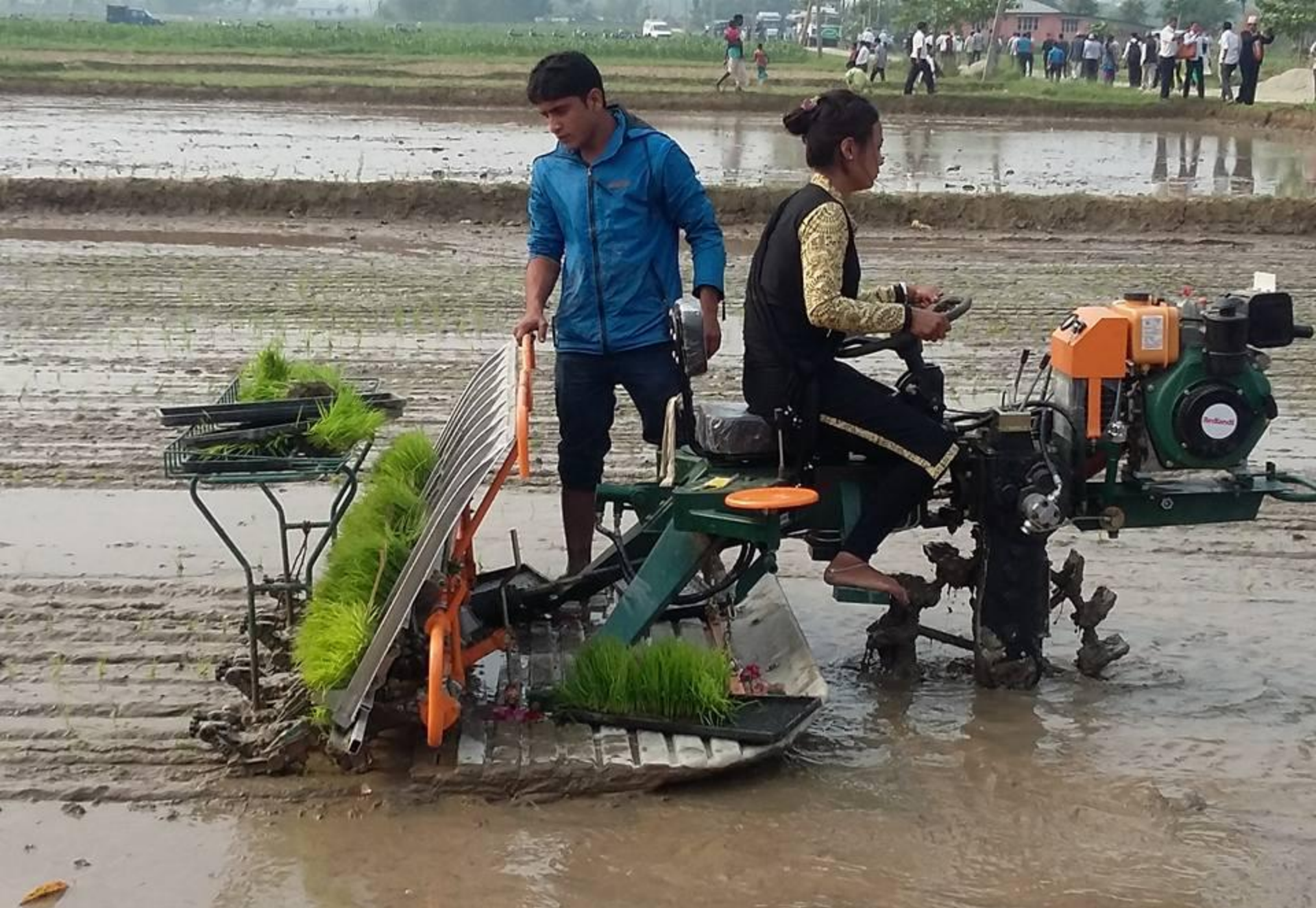
Rice transplanter चैते धान रोप्ने कार्य भै रहेको भापा जिल्ला