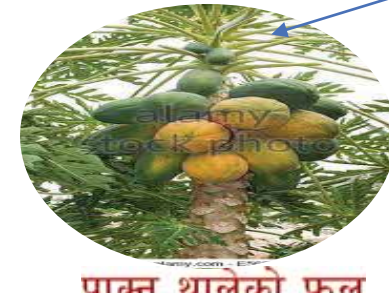
पाकन थालेको फल