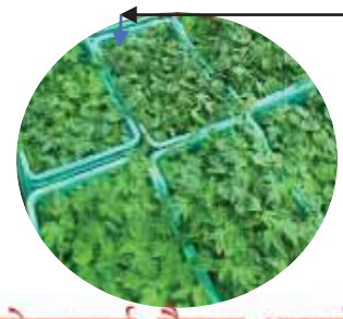
रोपनलाई तैयार भएको विरुवा