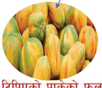
टिपिएको पाकेको फल

हावापानी : मेवा उष्णप्रदेशिय गर्मी हावापानी रुचाउने बाली हो । नेपालको तराई देखि ८०० मिटरसम्मको उँचाईमा यसको खेती गर्न सकिन्छ ।