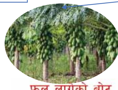
फल लागेको बोट