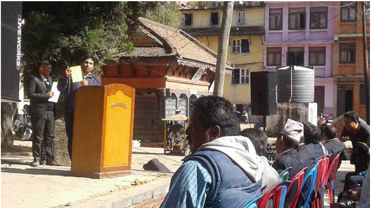
ešDk zfvfsf kðv, xl/ZrGb|nfd5fg]cfkmg]zfvfsf]ultlj lwsf]k|t'tls/of ub{