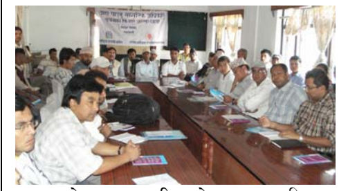
सूचनाको हकसम्बन्धी सचेतना अन्तरक्रिया कार्यक्रम : पाँचथर

थाहा पाउने अधिकार सम्बन्धमा जिज्ञासा र चासो बढाएको छ । यसलाई सीमान्त वर्गसम्म अभियानको रूपमा अघि बढाउन सहभागीबाट ठोस सुझाव प्राप्त भएको छ ।