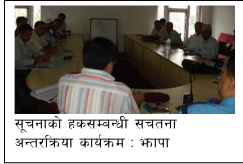
सूचनाको हकसम्बन्धी सचेतना अन्तरक्रिया कार्यक्रम : भ्वापा

अन्तरक्रियात्मक सचेतना कार्यक्रमबाट केही अपेक्षाहरू गरिएका थिए : सूचना लुकाउने संस्कृतिमा हुर्किएको प्रशासन, पारदर्शिताको अभाव रहेका संघसंस्था एवं सार्वजनिक निकायमा सूचना संस्कृति प्रारम्भ गराउन आवश्यक थियो । ऐन कानून र आयोग बनेर मात्र पुग्दैन, यसका लागि नागरिक जागरण र दबाव आवश्यक छ भन्ने महसुस गरिएको थियो । सूचना अधिकारको निर्वाध प्रचलन गराउन जनस्तरमा चेतना जागरण हुनुपर्छ र नागरिकले थाहा पाउने चाहना राख्दा उत्पन्न हुन सक्ने व्यवधान हटाउन सचेत नागरिक र आयोग स्वयम् क्रियाशील रहनुपर्छ आदि । सचेतना कार्यक्रमले आयोगको यो अपेक्षालाई प्रोत्साहित गरेको छ ।