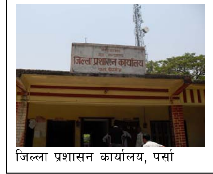
जिल्ला प्रशासन कार्यालय, पर्सा

१०. सूचना अधिकारीको रूपमा मात्रै काम काज गर्ने गरी छुट्टै दरबन्दी र कार्यक्षको व्यवस्था कुनै पनि कार्यालयमा नभएको हुँदा सूचना अधिकारी तोकिएको कर्मचारीले कार्यालयको अन्य नियमित कार्यहरू समेत गर्नु पर्ने भएकोले सूचनाहरू नियमित संकलन र अद्यावधिक गर्न कठिनाई हुने गरेको पाइयो । यसो हुँदा सूचनाहरूको विश्वसनीयता र सही सूचना प्रवाह नहुन सक्ने अवस्था रहने देखियो ।