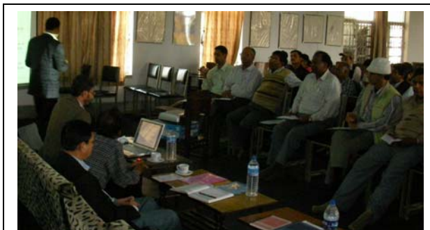
पूर्वाचल क्षेत्रीय अन्तरक्रिया गोष्ठी