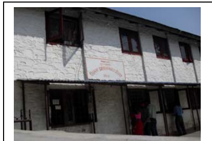
जिल्ला प्रशासन कार्यालय, गोरखा

४. जनताको अत्यधिक चासो र सरोकार रहने शिक्षा, स्वास्थ्य, विकास योजना तर्जुमा, सार्वजनिक निर्माण, वातावरण संरक्षण लगायतका विविध विषयका कार्यक्रमहरू सञ्चालन गर्दा सार्वजनिक निकायहरूले सार्वजनिक जानकारीको लागि प्रवाह गर्नुपर्ने भनी तोकिएको प्रावधानहरूको पनि परिपालना नभएको पाइयो ।