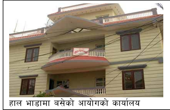
हाल भाडामा बसेको आयोगको कार्यालय

आयोगलाई आवश्यक पर्ने कर्मचारीहरूमा अर्को व्यवस्था नभए सम्मको लागि सचिव १, सह-सचिव १, उप-सचिव(प्रशासन) १, उप-सचिव(कानून) १, शाखा अधिकृत २ र नायव सुब्बा ३ गरी जम्मा ९ जना कर्मचारी सूचना तथा सञ्चार मन्त्रालयले काजमा उपलब्ध गराउने भनी निर्णय भएता पनि हाल शाखा अधिकृत १, लेखा अधिकृत १, मुद्रण अधिकृत १, ना.सु. १, र खरिदार १ गरी जम्मा ५ जना कर्मचारी मात्र सूचना तथा सञ्चार मन्त्रालयबाट खटाइएको छ । कार्यालय सहयोगी १, कुचिकार १ लाई आयोगद्वारा करार सेवामा लिई काम चलाइएको छ । आयोगको उद्देश्य अनुरूप संगठन सञ्चालन गर्न उल्लिखित जनशक्ति बिल्कुलै अपर्याप्त छ ।