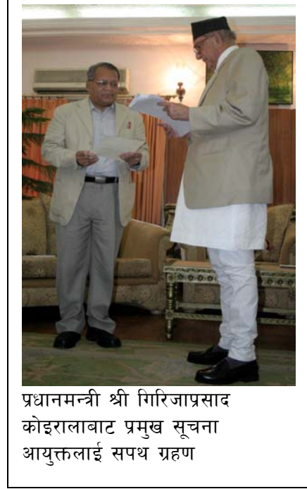
प्रधानमन्त्री श्री गिरिजाप्रसाद कोइरालाबाट प्रमुख सूचना आयुक्तलाई शपथ ग्रहण

ऐनको दफा १७ मा प्रमुख सूचना आयुक्त र सूचना आयुक्तको पारिश्रमिक, सेवासर्त र सुविधासम्बन्धी व्यवस्था तोकिएबमोजिम हुनेछ भनिएको छ । आयुक्तहरू नियुक्त गर्ने बेलामा नियमावली नबनेको र सेवासर्त स्पष्ट नभएको हुँदा नेपाल सरकारको मिति २०६५ बैशाख २२ गतेको मन्त्रीपरिषद्को बैठकले आयुक्तहरूको नियुक्तिसँगसँगै यस्तो निर्णय गर्‍यो :