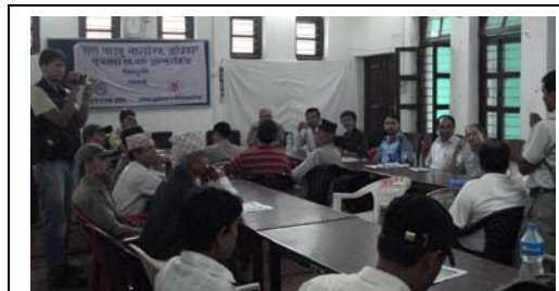
सूचनाको हकसम्बन्धी सचेतना अन्तरक्रिया कार्यक्रम : सिन्धुली

राष्ट्रिय सूचना आयोग र एसिया जर्नालिष्ट एसोसिएसन नेपालको सहकार्यमा “नागरिकको थाहा पाउने अधिकार” विषयक अन्तरक्रियात्मक कार्यक्रम सिन्धुली, पाँचथर र भूपा जिल्लामा सम्पन्न भयो । तीन जिल्लामा सरकारी कर्मचारी तथा समाजका विभिन्न वर्गका प्रतिनिधि गरी १२९ जना व्यक्तिको सहभागिता थियो । सूचनाको अधिकारबारे नागरिक तहमा भएको यो अन्तरक्रियात्मक सचेतना कार्यक्रमले