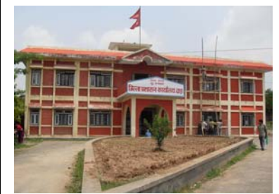
जिल्ला प्रशासन कार्यालय, दाडा

३. राष्ट्रिय सूचना आयोगबाट सूचनाको हकसम्बन्धी ऐन कार्यान्वयन सम्बन्धी अन्तरक्रिया कार्यक्रम सञ्चालन भएको भए तापनि त्यस कार्यक्रमबाट थोरै मात्रामा जानकारी प्राप्त भएको र यससम्बन्धी थप प्रचार-प्रसार मूलक कार्यहरू हुनुपर्ने ।