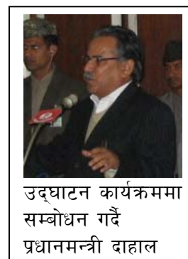
उद्घाटन कार्यक्रममा सम्बोधन गर्दै प्रधानमन्त्री दाहाल

डेमोक्रेसीका विभिन्न मोडेलहरू छन् । कतिपय मानिसले एउटा विशेष मोडेललाई सार्वभौम भनी ठान्छन्, तर त्यो गलत हो । समाजको विकाससँगै डेमोक्रेसीका मोडेलहरूको पनि विकास हुन्छ, परिवर्तन हुन्छ, परिमार्जन हुँदै जान्छ, र त्यो त्यति नै बढी डेमोक्रेसी प्रभावकारी हुन्छ, वैज्ञानिक हुन्छ, जति त्यो बढीभन्दा बढी जनतालाई सूचना प्राप्त गर्ने अधिकारद्वारा सुसज्जित गर्छ र सूचना प्राप्त गर्ने जिज्ञासा र