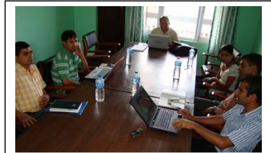
अध्ययन टोलीका प्रमुख तथा आयोगका पदाधिकारीहरूबीच छलफल

आयोग र आर्टिकल नाइन्टिनका नेपालका प्रतिनिधि समेतको प्रत्यक्ष निर्देशनमा सर्वेक्षणका लागि प्रश्नपत्रहरू तयार गरिएका थिए । नमूना सर्वेक्षण काठमाडौं जिल्लाका केही सरकारी कार्यालयहरूमा गरिएको थियो । त्यसपछि संस्थाका प्रतिनिधिहरूले विभिन्न १५ जिल्ला र पाँचवटै विकास क्षेत्रका रोजिएका क्षेत्रीय कार्यालयहरूमा पुगेर उत्तर संकलन गरेका थिए । यस निमित्त १९८ सरकारी कार्यालयमा सर्वेक्षण टोली पुगेको थियो । सर्वेक्षणकर्तालाई कार्यालयको जानकारी बाहेक सूचनाको हक सम्बन्धी ऐनको कार्यान्वयनको अवस्था कार्यालय प्रमुख र सूचना अधिकारीको पदीय जिम्मेवारी, सूचना व्यवस्थापनको स्थिति र समग्रमा के अपुग छ र के चाहिन्छ भन्ने यथार्थ जानकारीमा आउने गरी सोध्न ३५ वटा (११ + २४) प्रश्नहरू दिइएका थिए । लगभग डेड महिना लगाएर यो सर्वेक्षण गरिएको थियो ।