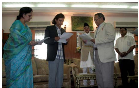
प्रधानमन्त्री र सूचना तथा संचार मन्त्रीको उपस्थितिमा आयुक्तहरूद्वारा शपथ ग्रहण

म..... मुलुक र जनताप्रति पूर्ण बफादार रही सत्य निष्ठापूर्वक प्रतिज्ञा गर्छु / ईश्वरको नाममा शपथ लिन्छु कि नेपालको राजकीय सत्ता र सार्वभौमसत्ता नेपाली जनतामा मात्र निहित रहनु पर्ने भनी जनताद्वारा जनआन्दोलन मार्फत् अभिव्यक्त भावनालाई उच्च सम्मान गर्दै मुलुकको संविधान र कानूनप्रति निष्ठावान रही आफूले ग्रहण गरेको प्रमुख सूचना आयुक्त/ सूचना आयुक्त पदको जिम्मेवारी र कर्तव्य कसैको डर, मोलाहिजा, पक्षपात, द्वेष वा लोभमा नपरी नागरिकको सुसूचित हुने हकको सम्मान गर्दै सूचनाको हक सम्बन्धी कानूनको प्रभावकारी प्रचलन र कार्यान्वयन गर्न क्रियाशील रहनेछु ।