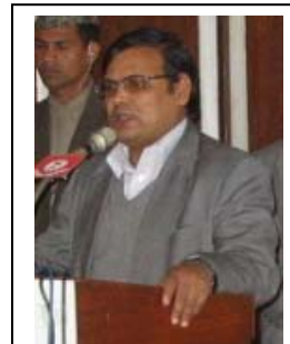
उद्घाटन कार्यक्रममा सम्बोधन गर्दै सूचना तथा संचार मन्त्री महारा

मैले बुझेको सुशासन गर्ने हो भने निर्णय प्रक्रिया पारदर्शी हुनुपर्छ । निर्णय प्रक्रियाका आधारहरू र केका लागि त्यो निर्णय गरियो भन्ने कुराहरू सरोकारवालाले जान्नु पनि पर्दछ । त्यसमा एक्सेस हुनुपर्छ । पहुँच हुनुपर्छ । त्यो भनेको पारदर्शिता हो ।