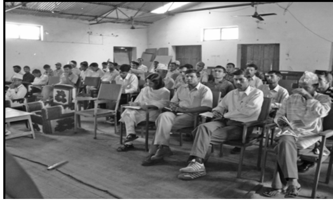
अछामको सदरमुकाम मंगलसेन बजारस्थित जि.वि.स.को सभाकक्षमा आयोजित सूचनाको हकसम्बन्धी सचेतना कार्यक्रमका सहभागीहरू ।

कार्यक्रममा राष्ट्रिय सूचना आयोगको कार्यलय केन्द्रीय स्तरमामात्र नभई जिल्ला स्तरमा पनि राखिनु पर्छ, जसबाट सूचनाको हकसम्बन्धी ऐन राम्ररी कार्यान्वयन हुने सहभागीहरूको विचार थियो ।