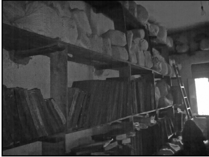
जिल्ला शिक्षा कार्यालय मोरङ