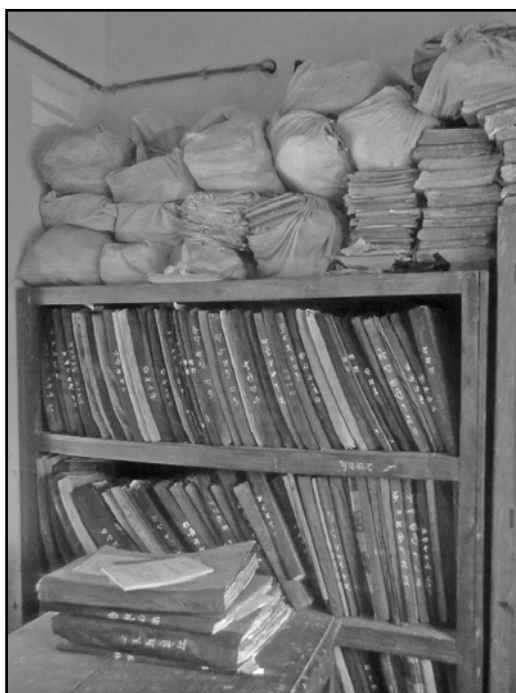
जिल्ला भूमिसुधार कार्यालय, भापा