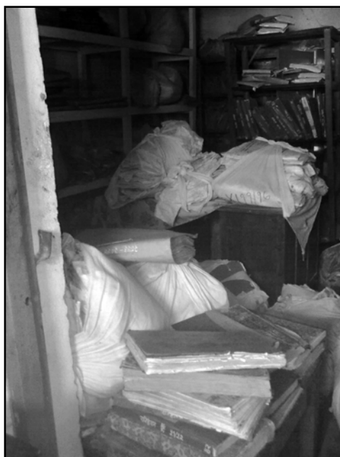
मालपोत कार्यालय, भापा ।