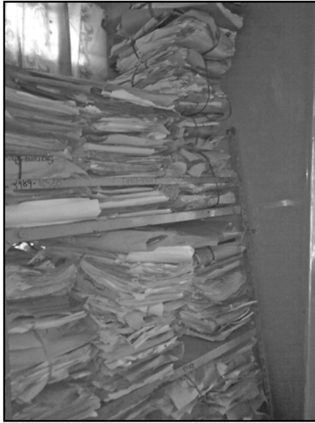
मालमोत कार्यालय, मोरङ ।