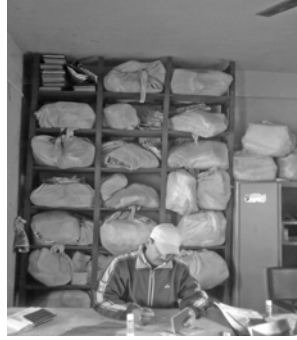
राहदानी फाँट, जिल्ला प्रशासन कार्यालय, भापा