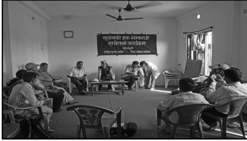
वर्दिया जिल्लाको गुलरियामा आयोजित सूचनाको हकसम्बन्धी सचेतना कार्यक्रम ।