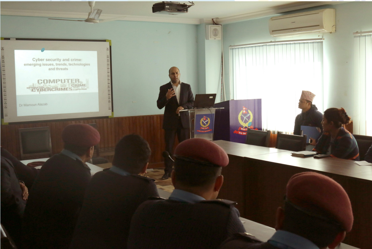
साईबर क्राईम तथा सुरक्षा सम्बन्धि छलफल (२०७४ मंसिर २९ गते)