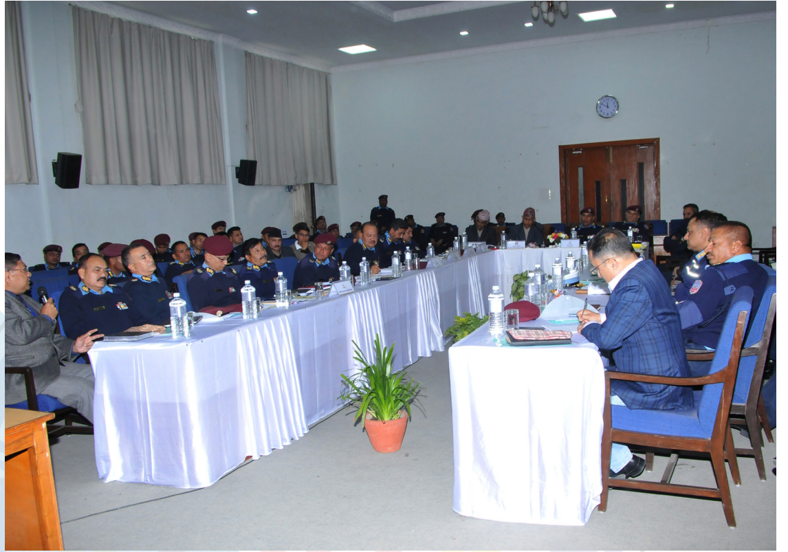
फौजदारी कानून कार्यान्वयन सम्बन्धी अन्तरक्रिया / छलफल कार्यक्रम