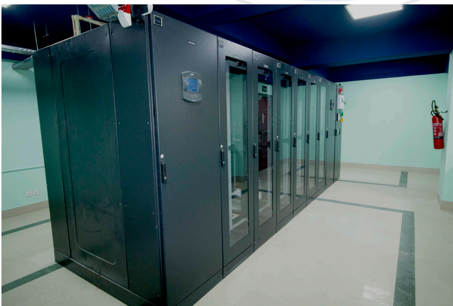
fig.1 Data center fig.2 Back up room fig.3 Data centre core room