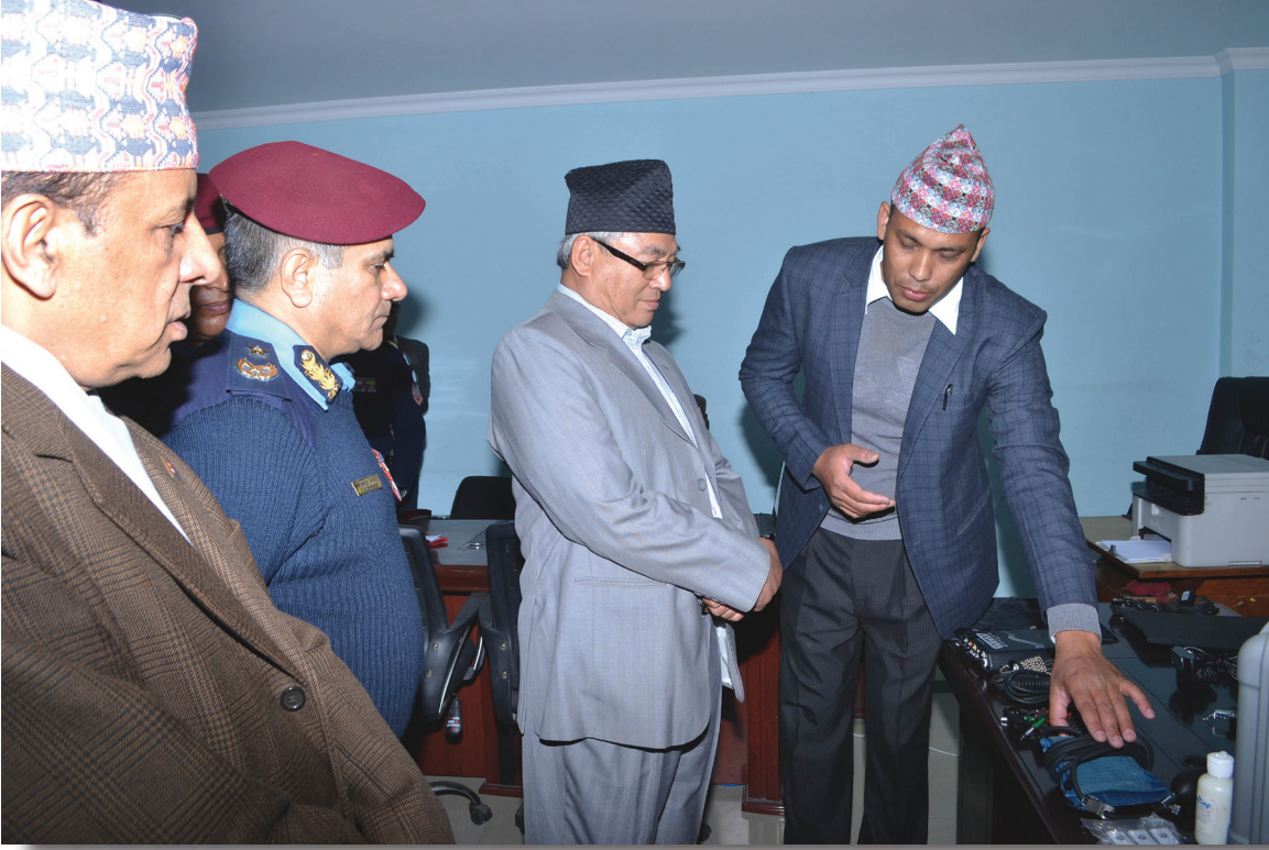
निरीक्षण भ्रमणका क्रममा गृहमन्त्री थापाले प्रहरी प्रधान कार्यालय पोलीग्राफ सेक्सनको निरीक्षण गर्नुहुदै,