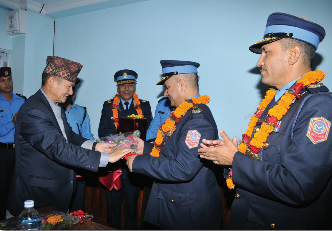
अपराध अनुसन्धान विभागका प्रमुखको तथा प्रहरी नायव महानिरीक्षकहरुको विदाई समारोह