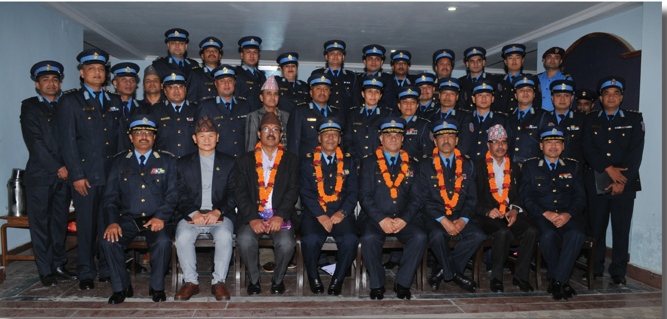
अपराध अनुसन्धान विभागका प्रमुखको तथा प्रहरी नायव महानिरीक्षकहरुको विदाई समारोह