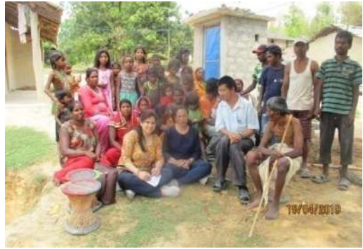
सिन्धुली जिल्लाको मुसहरवस्ती