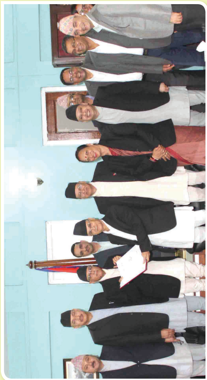
चौथो योजनाको प्रतिवेदन हस्तान्तरण समारोह