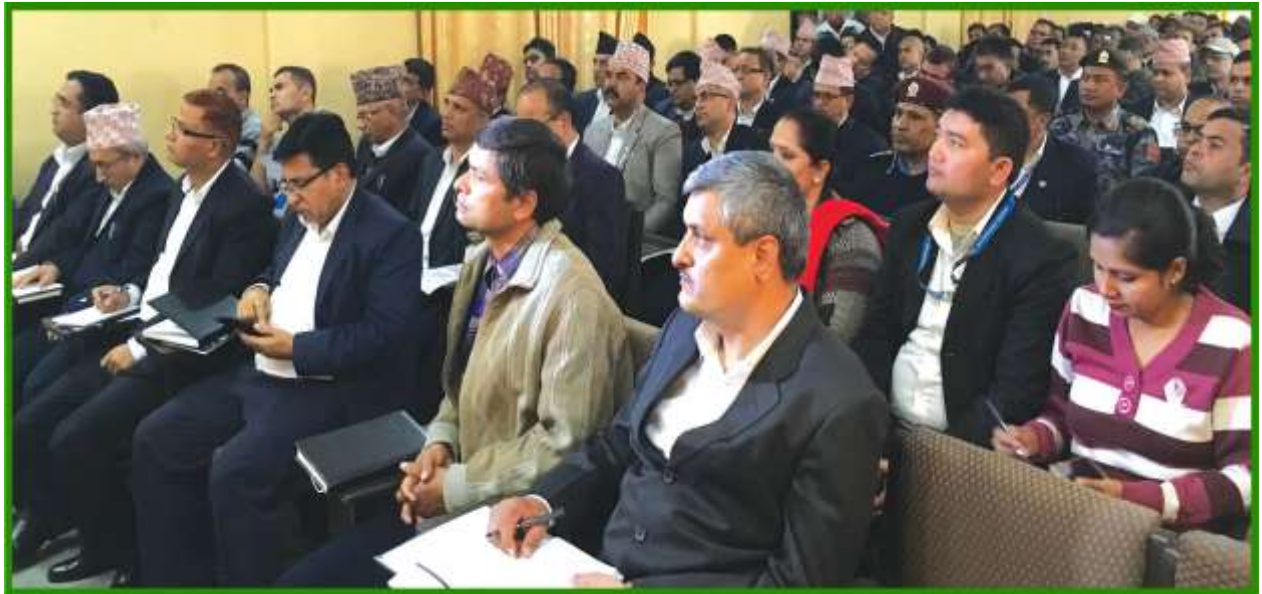
बुटवलमा आयोजित लेखापरीक्षण अन्तर्क्रिया कार्यक्रममा सहभागी अतिथिगणहरु