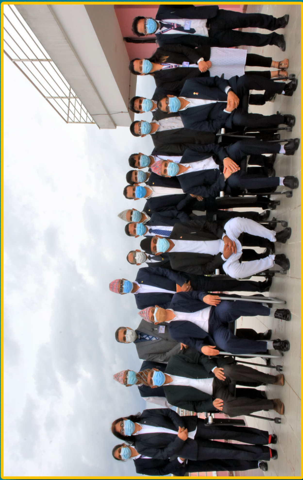
माननीय महान्यायाधिकाऱ्यांसाथमा योजना तर्जुमासंलग्न पदाधिकारीहरु