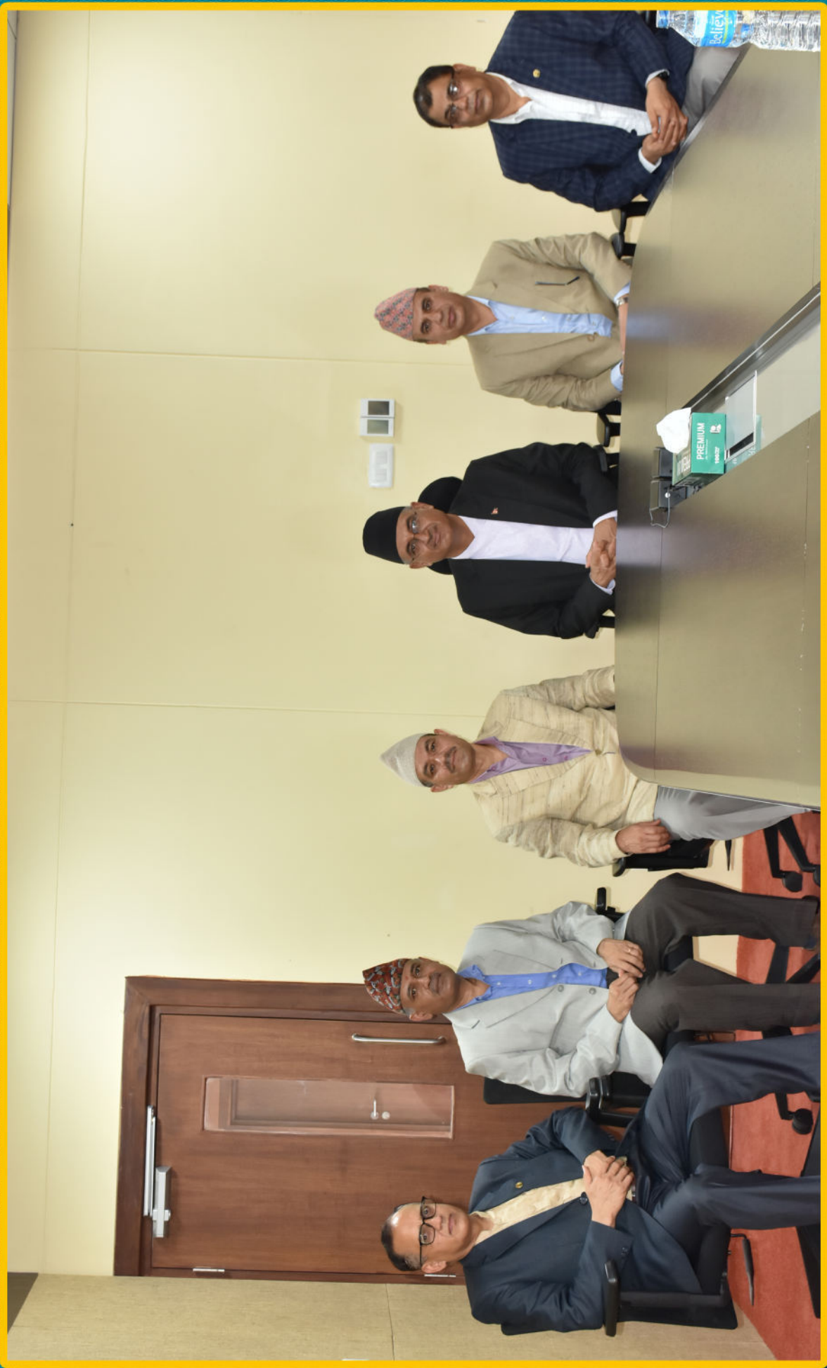
महान्यायाधिक्तको कार्यालय व्यवस्थापन समिति