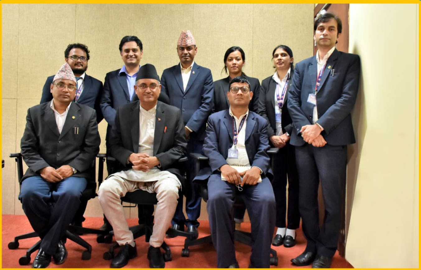
माननीय महान्यायाधिवक्ता श्री रमेश वडालज्यूसंग योजना तर्जुमा कार्यसमूहका पदाधिकारीहरु