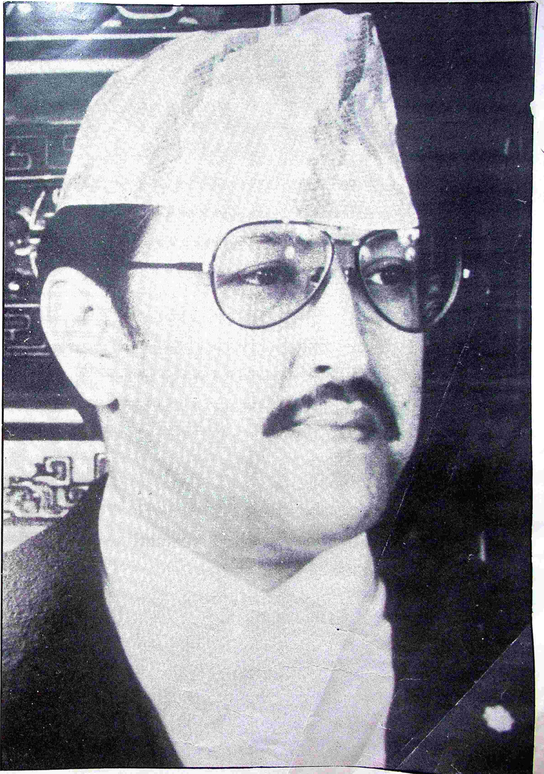
श्री ५ महाराजाधिराज वीरेन्द्र वीर विक्रम शाहदेव सरकार