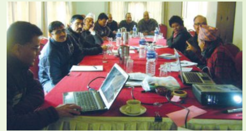
तालिम निर्देशिका तर्जुमा गर्न छलफल गरिदै

संघीय मामिला तथा स्थानीय विकास मन्त्रालय, स्थानीय शासन उत्तरदायी संयन्त्रको सचिवालयले स्थानीय निकायमा सामाजिक जवाफदेहिता अभिवृद्धि सँगै सुशासन प्रवर्द्धनका लागि जिल्ला स्थित नागरिक समाजका संस्थाहरुबाट (तेश्रो पक्ष) अनुगमन गरी मन्त्रालयबाट जारी गरिएका ऐन, नियम तथा कार्यविधि अनुसारका क्रियाकलापहरु सञ्चालन भए नभएको अनुगमन गरी हुन नसकेको अवस्थामा स्थानीय निकाय र नागरिक समाजका संस्थाहरु विचको छलफलबाट ती विषयमा