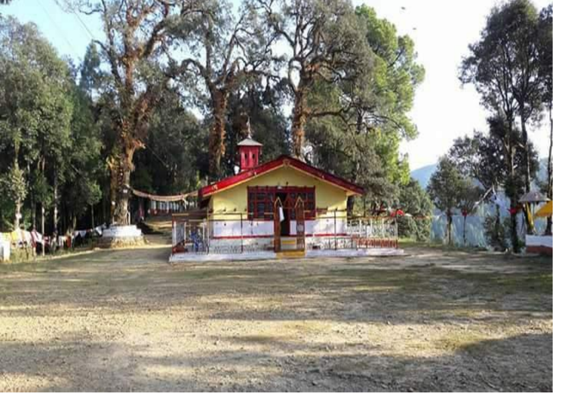
मालिकार्जुन मन्दिर (मालिकार्जुन गा.पा. वडा नं. ३)