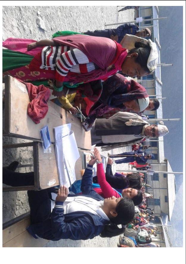
मतदान गर्दै मतदाताहरू (श्री गार्जाकाली अगावी, श्रीनगर मतकेन्द्र)