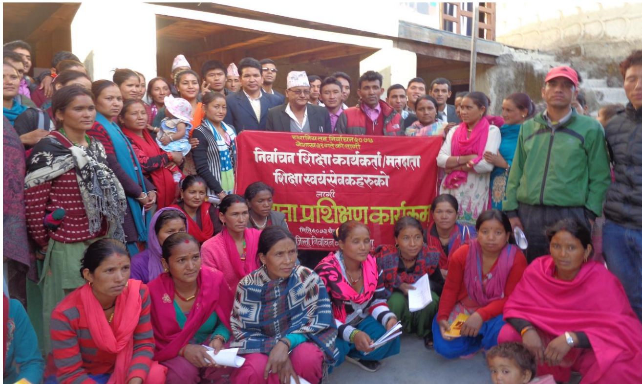
निर्वाचन शिक्षा कार्यकर्ता एवं मतदाता शिक्षा स्वयंसेवकहरुको लागि प्रशिक्षण कार्यक्रममा सहभागीहरु