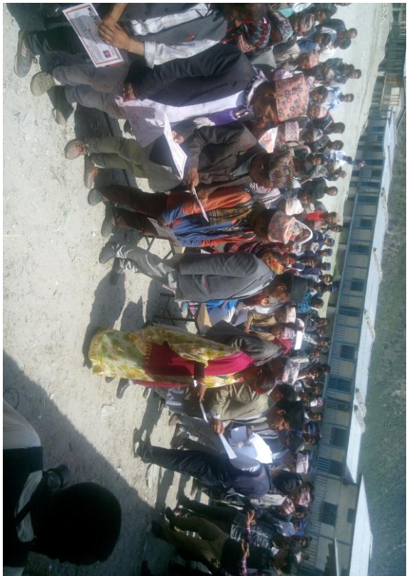
जलपेटिकाको सिल काट्दै गान्जिना गनदान केन्द्र आधिवृत्त