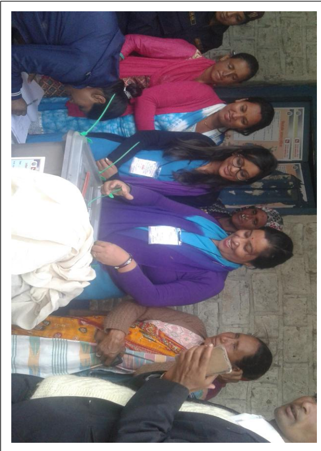
गतपेटिकाको सिल बन्द गर्दै महिला मतदान केन्द्र आधिकृत