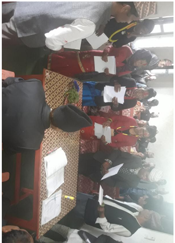
सपथ ग्राहण गर्दै निर्वाचित जनप्रतिनिधीहरु