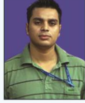
राजन श्रीवास्तव जिल्ला निर्वाचन अधिकारी