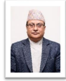
निर्वाचन आयुक्त श्री नरेन्द्र दाहाल