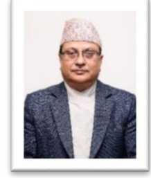
निर्वाचन आयुक्त श्री नरेन्द्र दाहाल